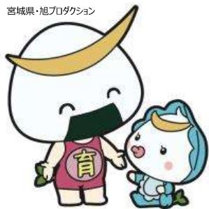
みやぎ・どこでも授乳室 プロジェクト