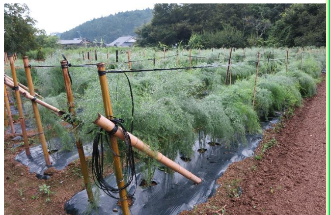
▲アスパラガス採りつきり栽培® (高収益作物の一例)

という点が問題となるため、今回の勉強会をはじめとした各種の取組を実施しています。