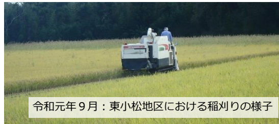
令和元年9月：東小松地区における稲刈りの様子

ほ場整備事業の実施により、工事前後で土地の区画が大きく変わることになります。工事後の土地に対応した権利関係を再編成する必要がありますが、権利の移転・設定・消滅等の全ての法手続をそれぞれの土地で行うことは困難といえます。ここで、工事前の土地と、これに対応して配分された工事後の新しい区画の土地(換地)を法律上同一とみなし、工事前の土地に設定されていた各種権利を、土地の変更と同時に一挙に移すことで、権利関係再編成の問題を解決する法制度が「換地処分制度」です。