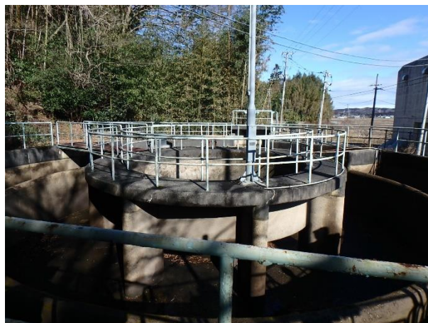
▲前谷地三方円筒分水工

河南矢本土改良区が管理する前谷地揚水機場の裏手には、フシギな形の建造物が佇んでいます。コレは何でしょうか…？