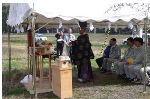
▲安全祈願祭の様子

平成24年10月25日、東日本大震災の津波により大きな被害を受けた石巻市大川地区における針岡工区の農地災害復旧除塩工事の開始にあたり、安全祈願祭が開催され、関係者等、約20名が参加しました。