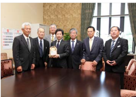
▲安住衆議院議員への訪問