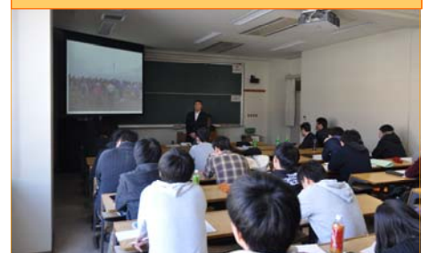
公開授業「震災復興と農村計画」