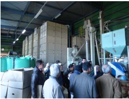
▲「(有) 耕谷アグリサービス」ライスセンター視察の様子

視察先は、宮城県名取市の「有限会社 耕谷アグリサービス」です。設立までの経緯とその時の中心メンバーの苦勞、水稻・麦・大豆の土地利用型部門を中心として園芸部門を組み合わせた経営の展開、震災からの復興としてコットンプロジェクトへ参加したことなど、この会社が地域・自然との共生を目指し、土地利用型農業を実践することを理念としていることについて説明がありました。