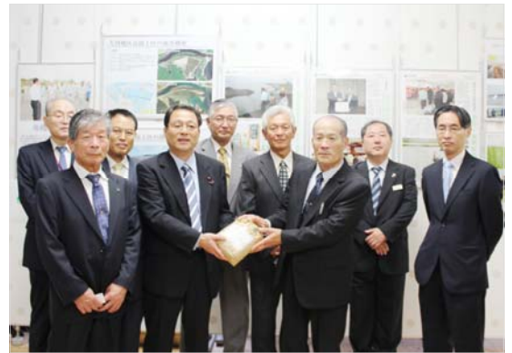
▲郡司農林水産大臣と石巻地区理事長会

また、石巻地域の復旧・復興等の状況説明や感謝の気持ちをお伝えするため、地元選出の国会議員や復興大臣への御礼訪問も行われました。この訪問では、意見交換も行い貴重な話し合いの場となりました。