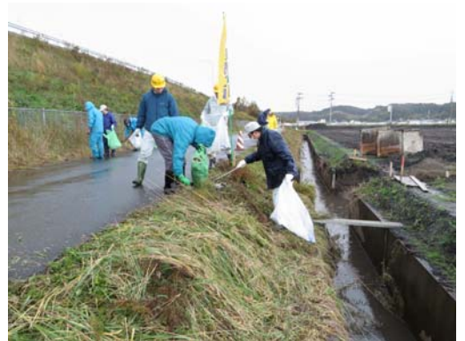
▲クリーン活動の様子