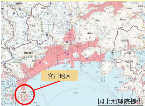
石巻管内津波浸水範囲概況図

平成24年12月25日、東松島市宮戸地区において、東日本大震災で大きな被害を受けた農地海岸保全施設と背後農地の災害復旧工事着手にあたり安全祈願祭が開催され、市、県、工事関係者等約60人が出席しました。