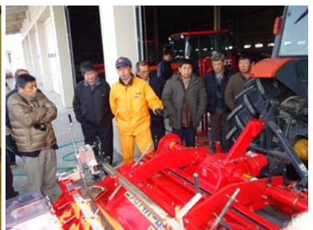
▲ 古川農業試験場視察の様子