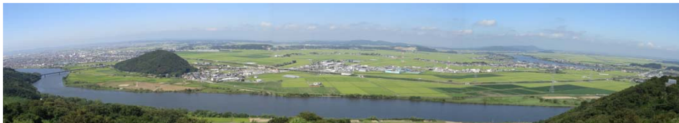
トヤケ森から望む石巻管内の風景

「いしのまきNN通信」は、石巻地域の農業農村整備事業に関連する活動等を広くお知らせすることを目的に、年3回程度発行しています。掲載希望の情報等がありましたら農村振興班までご一報ください。今後ともよろしくお祈いします。