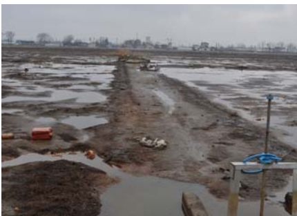
▲大曲地区被災農地