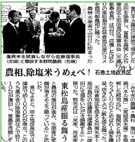
▲ 河北新報 H24.10.24