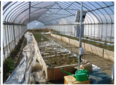
▲ パイプハウスでのアスパラガス栽培の様子

その後、農用地利用改善組合と農業生産法人の代表者から話題提供があり、田面標高が低い地域における転作の取組方法として水田ゾーンや畑ゾーンを固定化した土地利用調整のあり方や地域の合意形成の進め方、大規模経営の安定と発展に向けた施設園芸の導入により地域雇用の創出による地域との共生など、それぞれが抱える問題点や課題について意見交換が行われました。