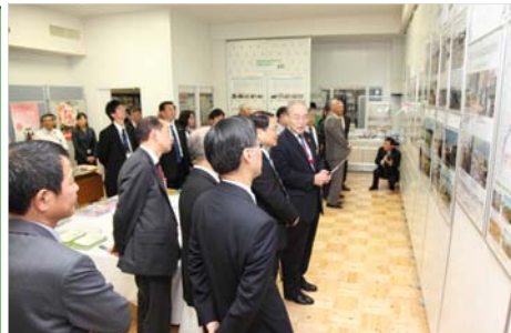
◀ 復旧・復興等の状況説明の様子