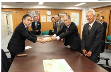
◀ 平野復興大臣への訪問