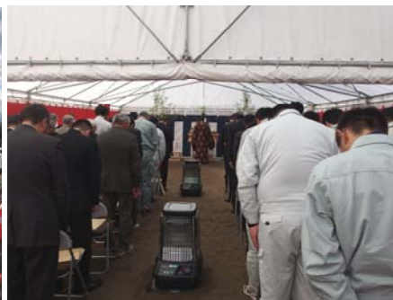
▲安全祈願祭の様子