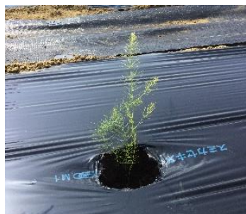
アスパラガスの苗 (は種後約90日)

次回の勉強会の開催は、5月13日(水)です。場所と時間は、直接普及センターまでお問い合わせください。内容は、病害虫対策や穴埋めについてです。