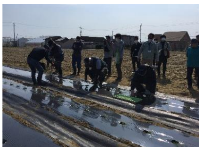
参加者が定植作業を体験