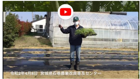
YouTube動画タイトル 「アスパラガス栽培管理勉強会(定植編)」

アスパラガス栽培に興味がある方、勉強会に行けなかった方、内容を確認したい方、ぜひYouTubeをご覧ください。