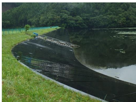
石巻市河北地域の農業用ため池・堤体（池側）