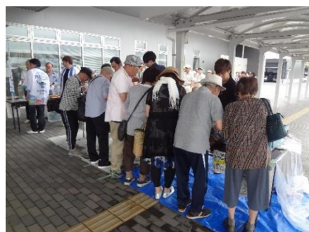
多くの人で賑わいました

7月5日、宮城県石巻合同庁舎において、「みやぎ水産の日」企画「ホヤ祭り 2019」販売会を開催しました。