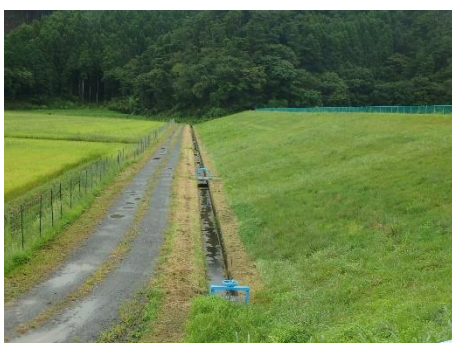
石巻市河北地域の農業用ため池・堤体（外側）

農業用ため池は、地区の営農を支える水源として、重要な役割を担っています。一方で、平成30年7月豪雨など、近年、豪雨等により多くの農業用ため池が被災し甚大な被害が発生しています。