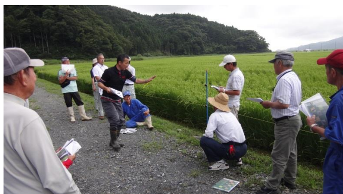
電気柵の正しい設置方法についての講義の様子

石巻管内では近年、野生鳥獣、特にニホンジカによる農作物被害が増大しています。農作物を守るには、防護柵で野生鳥獣の侵入を防ぐことが効果的です。