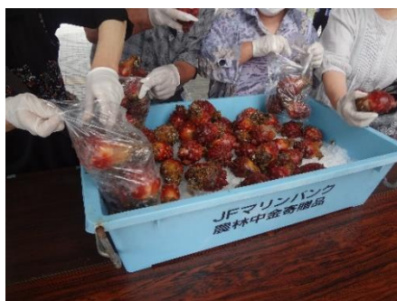
殻付きホヤの詰め放題