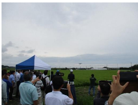
自動飛行ドローン