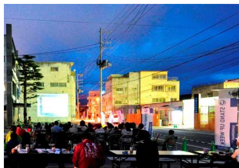
(昨年の野外映画上映会の様子)

3年目となる今年は、誰でも気軽にまちへの思いを語ることができるシンポジウム野外映画上映会、浴衣deまちコンなどが開催されます。石巻の復興を感じることができるイベントに皆様ぜひご参加下さい。詳しくは、ISHINOMAKI2.0までお問い合わせください。