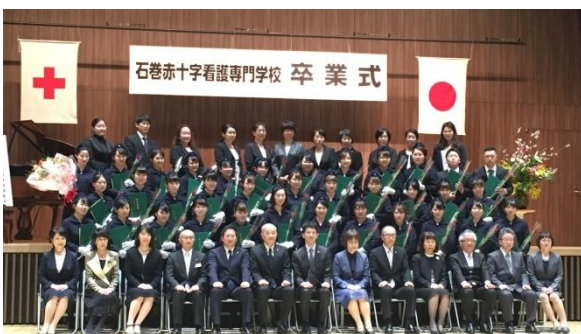
【石巻赤十字看護専門学校卒業式】

卒業後は、医療現場で看護師として働く方や進学する方など、それぞれの道に進むこととなりますが、学校で学んだことを糧に、1人1人が立派な医療人として長く活躍されることを心から期待します。