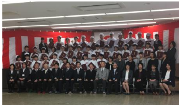
【石巻市医師会附属准看護専門学校卒業式】