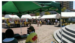
【大好評のイートコーナー】

参加した当事者や家族からも、他の事業所のメンバーや家族同士の交流の場となり、楽しい時間を過ごせた、できれば毎年実施して欲しいとの声も聞かれました。