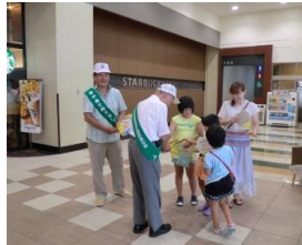
【イオンモール石巻での様子】

食中毒は暑い季節に多く発生します。家庭で食中毒を起こさないように衛生管理に気をつけましょう。