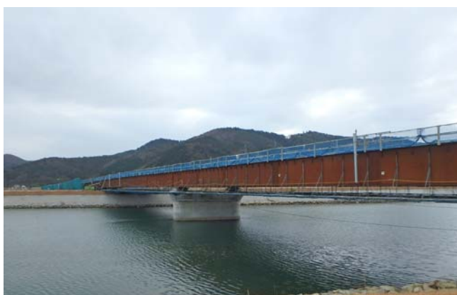
【(国)398号石巻バイパス (Ⅱ期)】