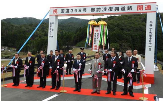
【(国)398号 御前浜復興道路開通式】