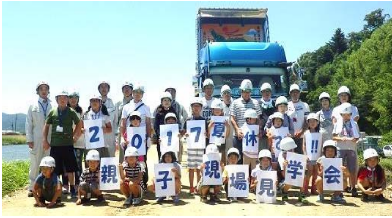
【親子現場見学会（大沢川外河川災害復旧工事（その2））】