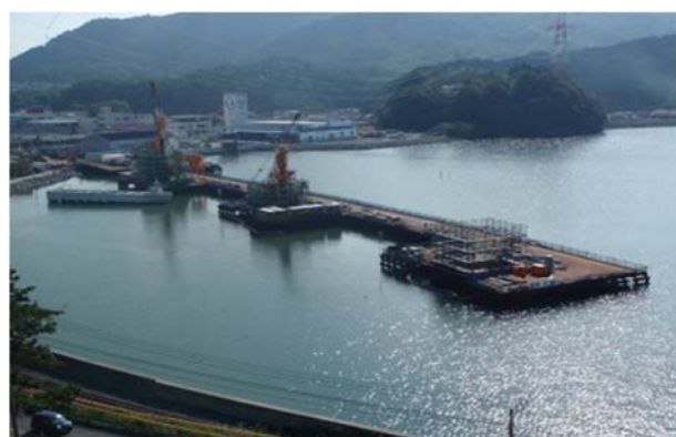
【(一)石巻女川線 浦宿バイパス】