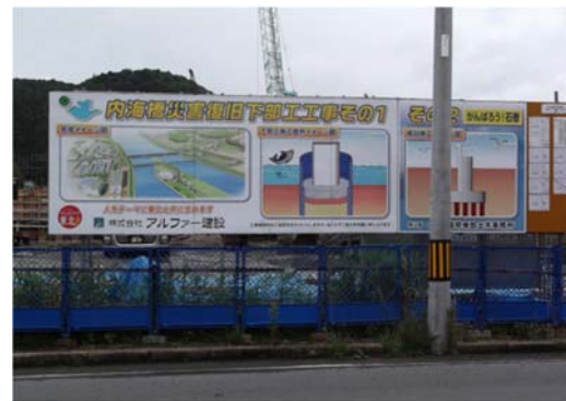
【内海橋災害復旧工事】