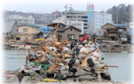
【津波被災直後(東内海橋)】