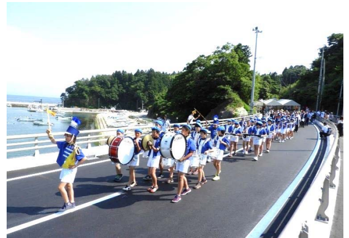
【(国)398号 新相川橋開通式】