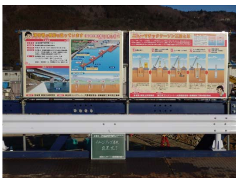
【浦宿道路改良工事】