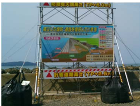
【清水田海岸災害復旧工事】