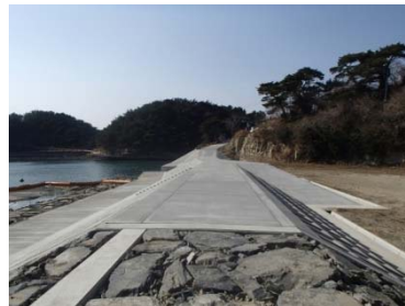
【鰐ヶ淵海岸（東松島市）】