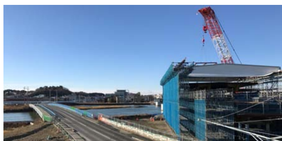
【現在、上流側に新内海橋工事中】