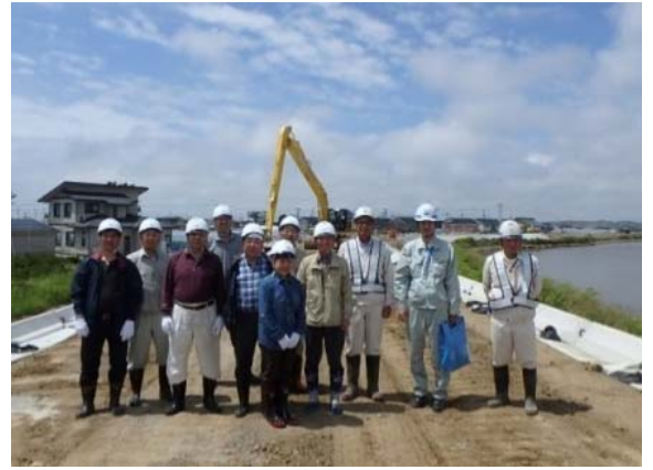
【定川河川災害復旧工事（その3）】