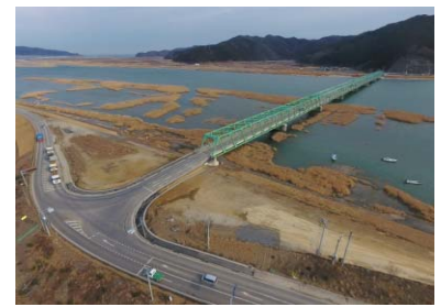
【新北上大橋（石巻市）】