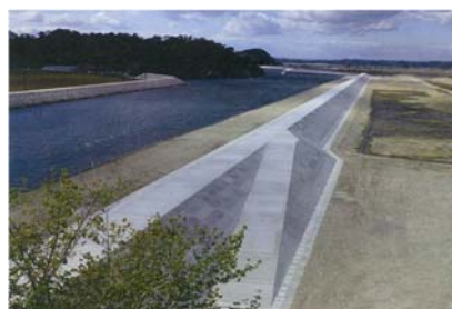
【東名海岸（東松島市東名）】