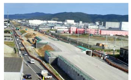
【(都)門脇流留線（石巻市魚町）】