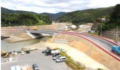
【女川橋（女川町宮ヶ崎）】