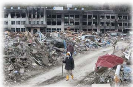
【石巻市門脇小学校】