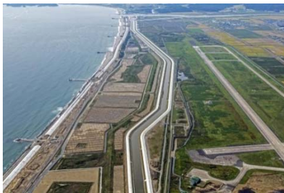
【北上運河（東松島市）】