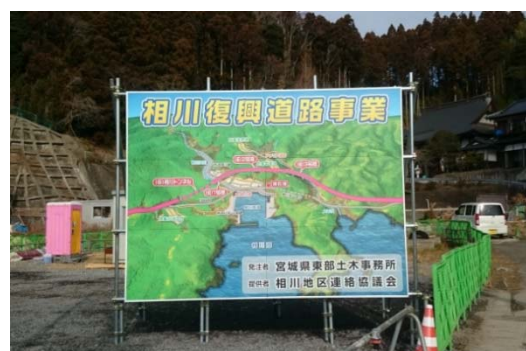
【相川復興道路工事】