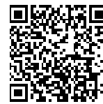
▲省エネ通知のページQRコード