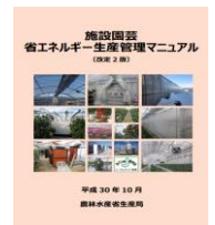
▲省エネマニュアル