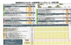
▲省エネチェックシート