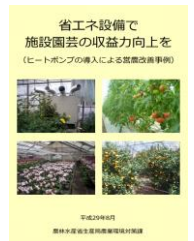
▲省エネで収益力向上を