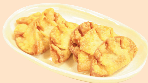
▲『女川のさんまの旨みがギョギョギョギョーザ』 「女川向学館」に通う中学生たちが考えた さんまのすり身入り揚げ餃子です。