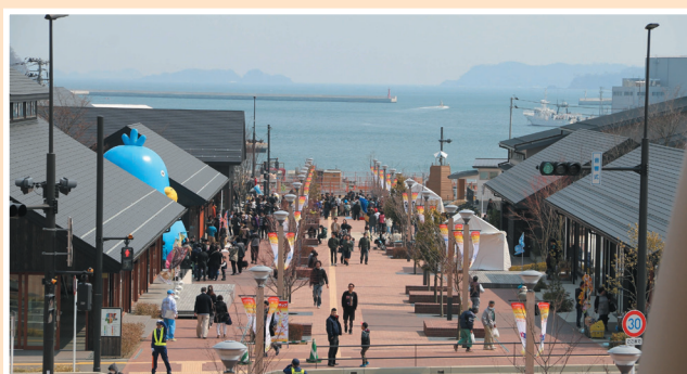
▲会場となった女川駅前の商業エリア