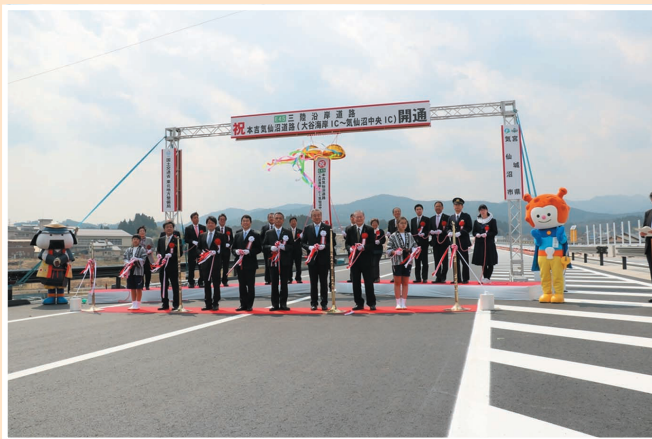
▲ 3月25日に開催された開通式