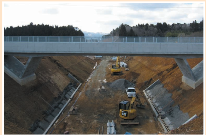
▲大谷海岸IC～本吉IC（仮）は今年度開通する予定 ※写真はH30年3月時点の小金沢地区