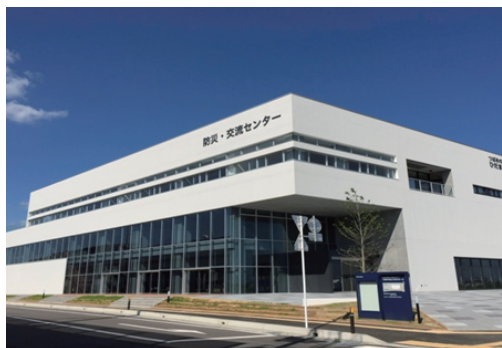
山元町防災拠点・山下地域交流センターが完成(山元町)