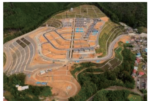
土地区画整理事業が進む宮ヶ崎地区(女川町)