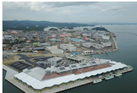
▲塩釜市魚市場（全景）