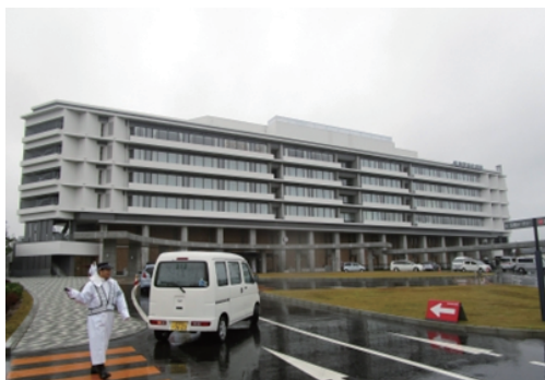
10月22日 気仙沼市立病院が完成(気仙沼市)