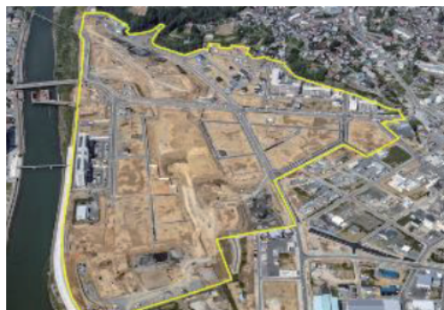
土地区画整理事業が進む南気仙沼地区(気仙沼市)