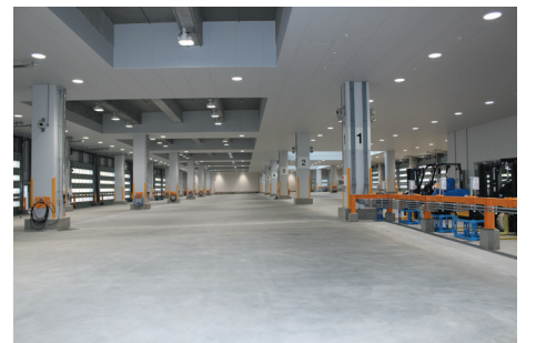
▲塩釜市魚市場（内部）