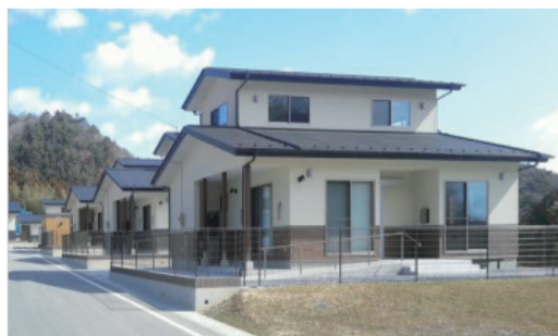
竹浦災害公営住宅(女川町)