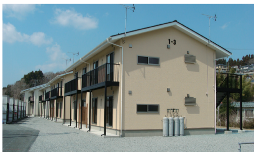
3月30日 市営宿浦住宅が竣工