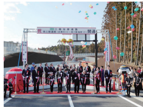
平成29年3月18日 開通式