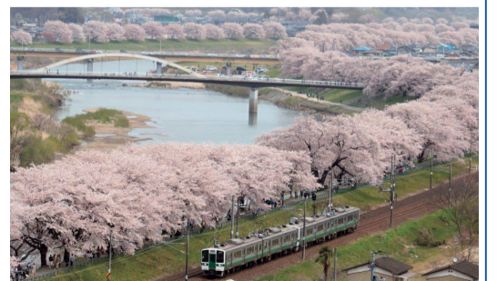
船岡城址公園から望む柴田町の桜