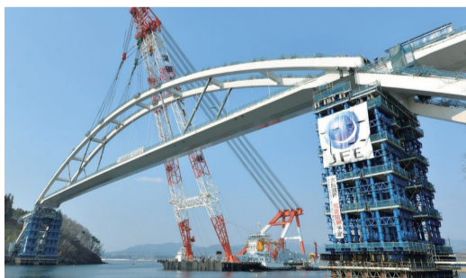
完成に近づく気仙沼大島大橋