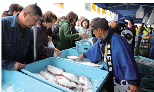
10月8日 荒浜漁港水産まつり（亶理町）