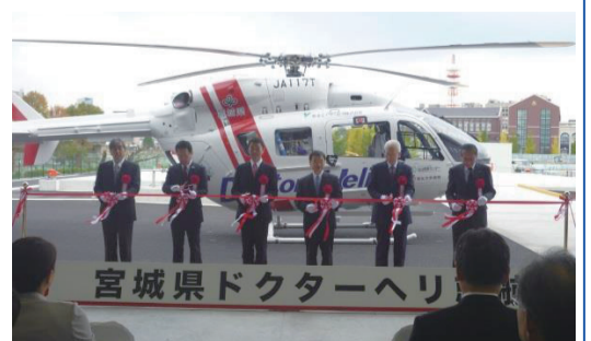
10月28日 ドクターヘリ運航開始（仙台市ほか）