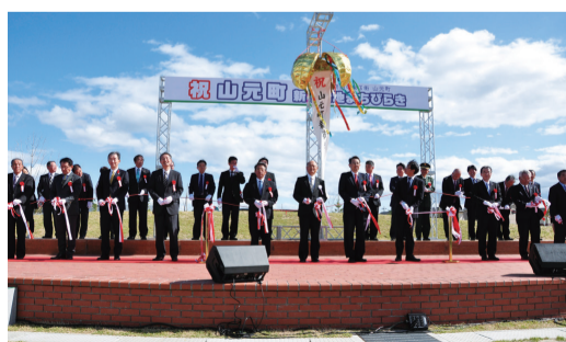
10月23日 新市街地まぢびらき（山元町）