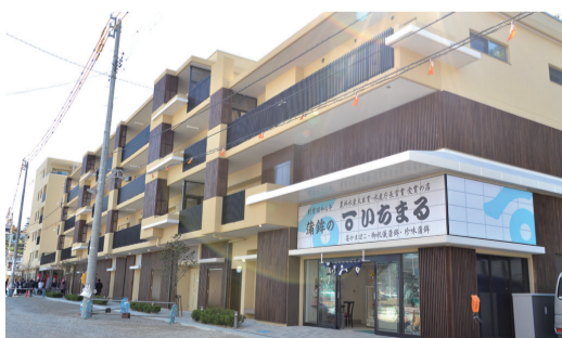
10月21日 気仙沼内湾（南町1丁目）地区災害公営住宅が完成（気仙沼市）