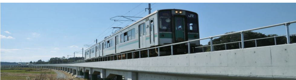
内陸部に移設した坂元駅付近を走行するJR常磐線の車両

平成28年12月10日、東日本大震災による被害で運行休止区間となっていた、「浜吉田駅－相馬駅」間の運行が約5年9ヶ月ぶりに再開されました。再開区間は約23.2キロで、津波で甚大な被害を受けた駒ヶ嶺駅－浜吉田駅の線路と、同区間内の新地、坂元、山下の3駅が内陸側に移設されております。今後、JR東日本では、常磐線に残る運休区間に関し、浪江－小高を平成29年春、竜田－富岡を平成29年内、富岡－浪江を平成31年度末に再開する見込みとしています。