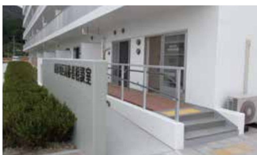
9月30日 鹿折地区高齢者相談室を開設 (気仙沼市)