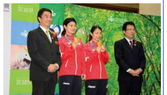
10月5日 リオ五輪バドミントンの高松ペアに 県民栄誉賞を授与(仙台市) ※所属：日本ユニシス