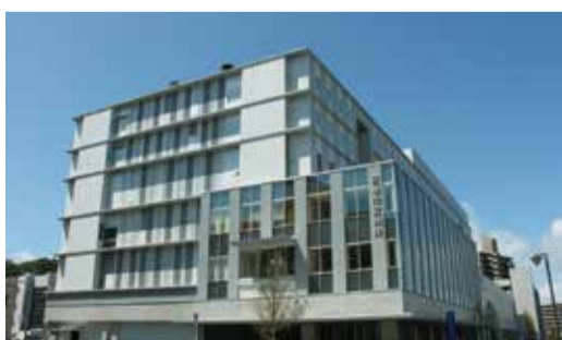
9月1日 市立病院が開院 (石巻市)