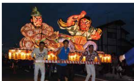
9月24日 あおい地区でまちびらき(東松島市)