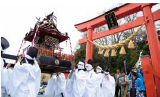
4月17日 9年ぶりの戸倉神社春祭り(南三陸町)