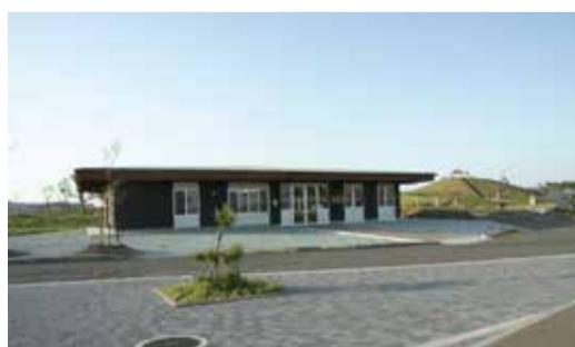
4月24日 千年希望の丘交流センターが開所(岩沼市)