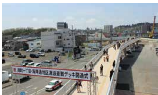
4月23日 港町一丁目・海岸通地区津波避難デッキが開通(塩竈市)