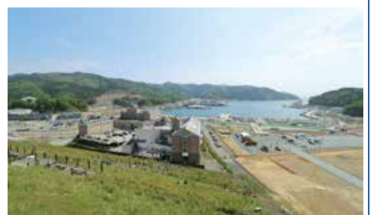
5月14日 復興が進む堀切山地区(女川町)