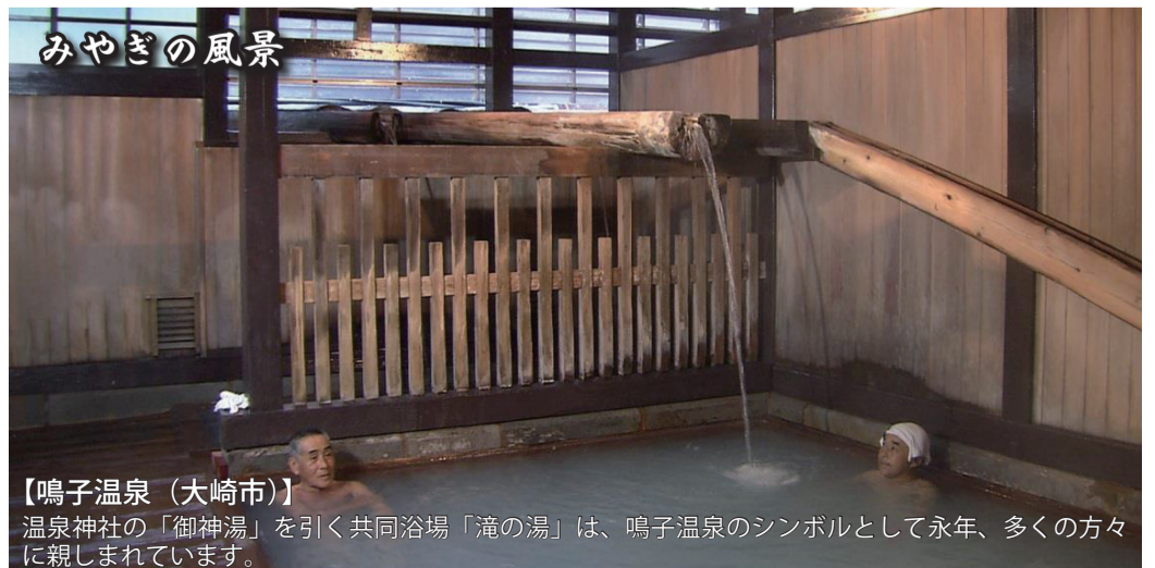
【鳴子温泉（大崎市）】 温泉神社の「御神湯」を引く共同浴場「滝の湯」は、鳴子温泉のシンボルとして永年、多くの方々に親しまれています。