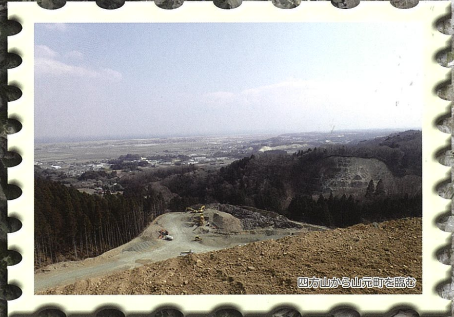
四方山から山元町を臨む