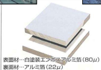
表面材…白塗装エンボスアルミ箔(80μ) 裏面材…アルミ箔(22μ)