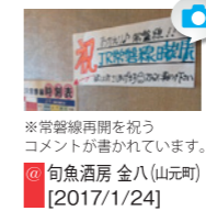
※常設線再開を祝うコメントが書かれています。旬魚酒房 金八(山元町) [2017/1/24]

SNSでは、取材チームが見た被災地のいまを発信しています。Facebook、Instagram、Twitterをご覧ください。皆さまからの投稿もお待ちしております。ハッシュタグ「#fukkomiyaagi」をつけて、撮影した画像をお寄せください。