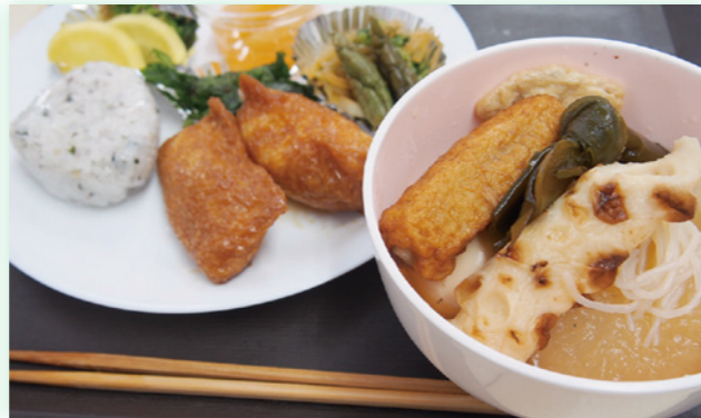
「あすと食堂」の料理は住民の得意料理が並びます。この日のメインはおでん。約30食があったという間に売り切れました。