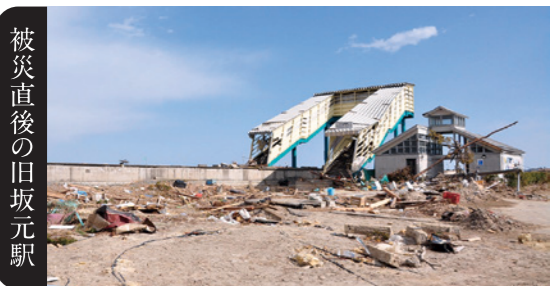
無料アプリ「ココアル2」を起動し、上記の被災直後の写真にかざすと、現在(平成29年1月)の坂元駅の様子をご覧いただけます。

COCOAR2のダウンロードは「Google play」「App Store」から COCOAR2に対応していない端末もごさいます。