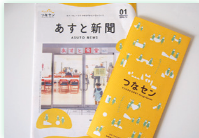
年4回発行の「あすと新聞」やFacebookなどで、活動の様子を情報発信している

づくりを多数企画。まちあるきイベント、ふらりと立ち寄れるカフェ、音楽好きな人が思わず立ち寄りたくなる演奏会など、一人でも参加しやすく、人々の幅広いニーズに応えられるようなきめ細かさが重視されているのが特徴です。参加者も支援者もさらなる多様化をすることで、誰もが交流する機会をもつコミュニティの実現を目指しています。