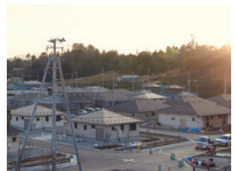
整備を進める災害公営住宅