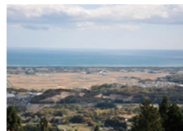
(深山山頂から町内を望む)