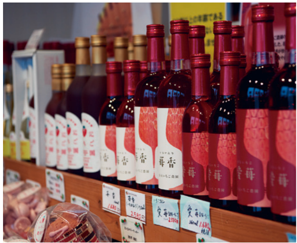
いちごワイン ワインは現在3種類を販売。「愛苺(まないちご)」などの名称は、スタッフ皆で考えました。