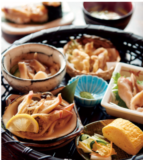
ほつき御膳 大きく味の良いほつき貝を厳選しています。