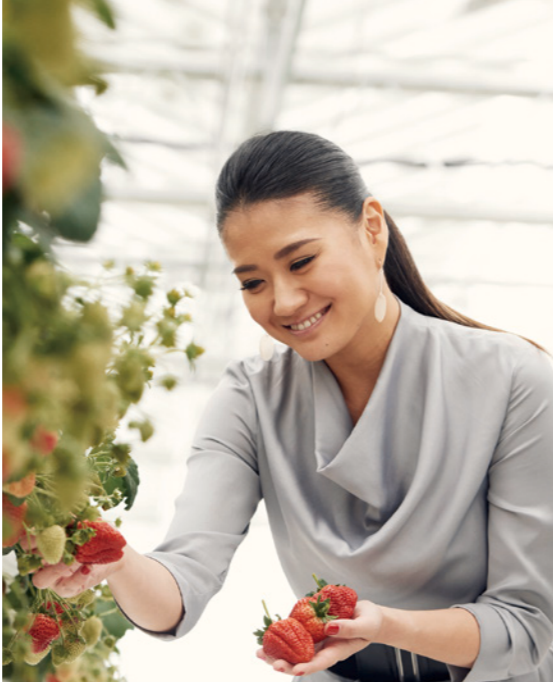
山元いちご農園 いちごの栽培は、ハウス10棟と1万平方メートルの大型ハウスで行われています。