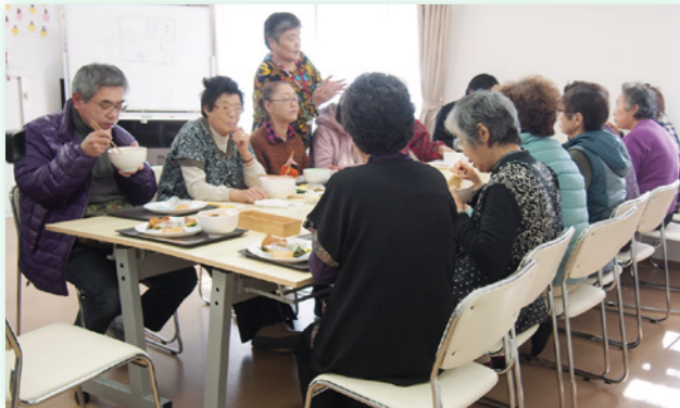
支援される側、する側の垣根を感じないようなイベントにしていきたいという「あすと食堂」。

地域と人をつなぎ、楽しみながら支えあう仕組みづくり (特定非営利活動法人つながりデザインセンター・あすと長町)