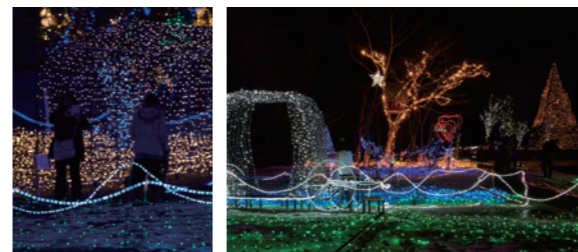
コダナリエのイルミネーション