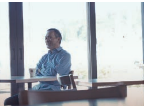
海が見える窓辺で「カフェも併業と同じ。いつもお客さんがどんな顔するか考えてます」。