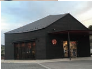
K-port 建築家・伊東豊雄さんが設計した建物は黒。スタイリッシュな姿です。