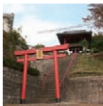
毎年1月に初舞奉納をする飯網神社