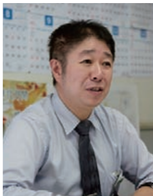
気仙沼市建設部都市計画課