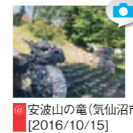
安波山の竜(気仙沼市) [2016/10/15]

SNSでは、取材チームが見た被災地のいまを発信しています。Facebook、Instagram、Twitterでご覧ください。皆さまからの投稿もお待ちしております。ハッシュタグ「#fukkomiyaagi」をつけて、撮影した画像をお寄せください。