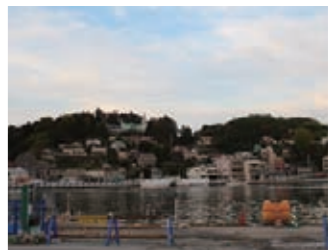
気仙沼は内湾がとても美しい。