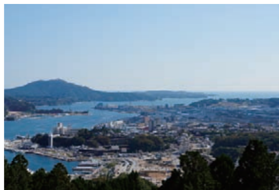
市中心部の街並み(安波山より) 港や水産施設の整備が徐々に進む一方で、まだ茶色の更地も目立ちます。