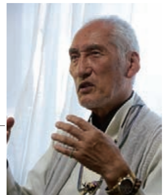
気仙沼市指定無形民俗文化財浪板虎舞保存会 会長

アメリカのモース高校のシンボルが虎であることが縁で、生徒たちから激励の手紙や千羽鶴が寄贈されました。その