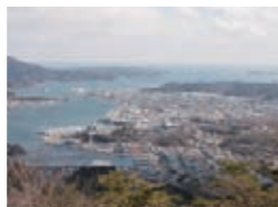
(安波山からの眺め)