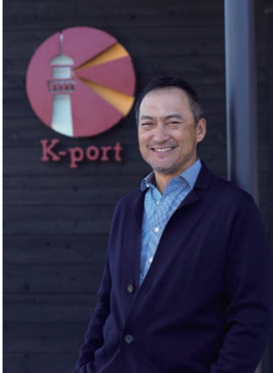
名前の由来は「心の港」 「戻ってきたいと思ったときに、いつでも戻れる場所にしたい」という気持ちがかもっています。