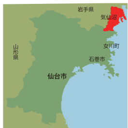
▼今回訪れたまち ▲ 気仙沼市は、宮城県と岩手県の県境にあり、漁業が盛んな港町。なかでもカツオ、メカシキ、サメの水揚げは日本一を誇ります。観光PRキャラクターの「ホヤぼー」も人気。

MA NOW IS KESENNUMA NOW IS KESENNUMA NOW IS KESENNUMA NOW IS KESENNUMA NOW IS KESENNUMA NOW IS KESENNUMA NOW IS KESENNUMA NOW IS KESENNUMA NOW IS KESENNUMA NOW IS KESENNUMA NOW IS KESENNUMA NOW IS KESENNUMA NOW IS KESENNUMA