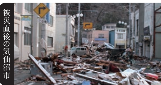
被災直後の気仙沼市 無料アプリ「ココアル2」を起動し、上記の被災直後の写真にかざすと、現在(平成28年10月)の気仙沼市の様子をご覧いただけます。

COCOAR2のダウンロードは「Google play」「App Store」から COCOAR2に対応していない端末もごさいます。