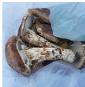
ひらいたマツタケは、いい香りです

楽しめます。取材時はちょうどマツタケが旬。帰りに立ち寄った「さかなの駅」で袋いっぱい、とれたてを(お手頃価格で)買いました。