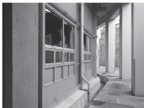
茂庭浄水場薬品処理館で50枚程度の窓ガラスが割れた状況→