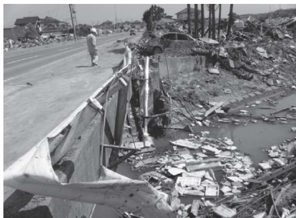
水管橋の被災状況