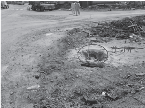
がれきを排除しながら漏水箇所を探し、復旧作業を行っている。