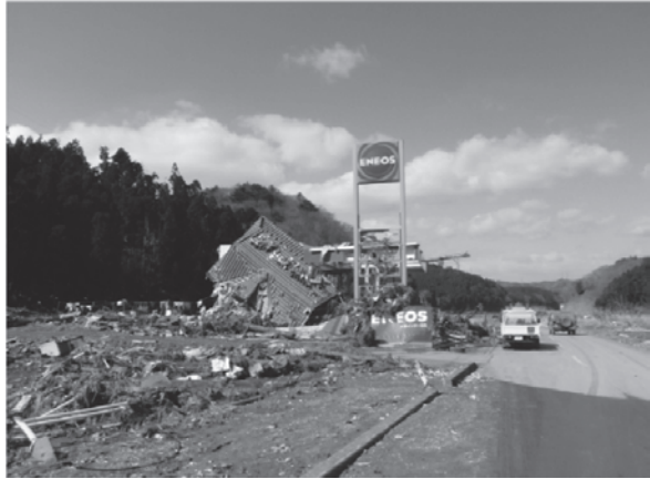
県道に埋設されていた配水管が、津波により露出している状況