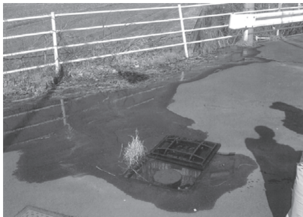
空気弁からの漏水状況