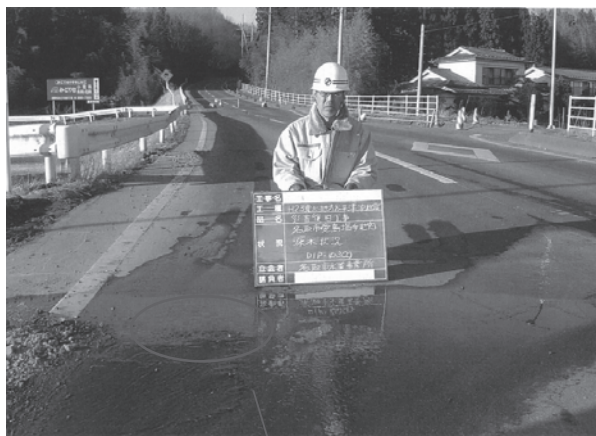
配水管からの漏水状況