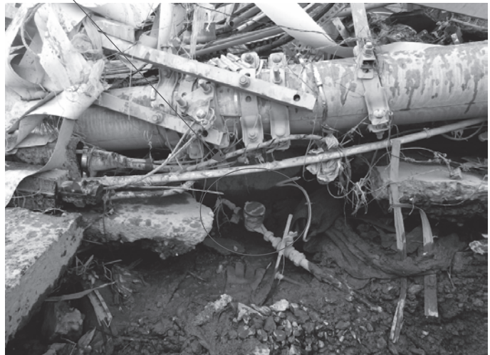
※水道管理設位置に堆積しているがれきの状況

水道管理設位置に多くのがれきがあり、がれきの仮寄せを行いながら、配水管等の復旧作業を行っている。