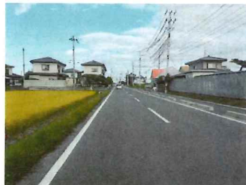
完成②（起点部～中間部を望む）