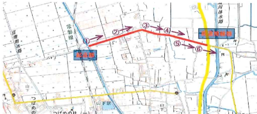
施工位置図（撮影位置付記）