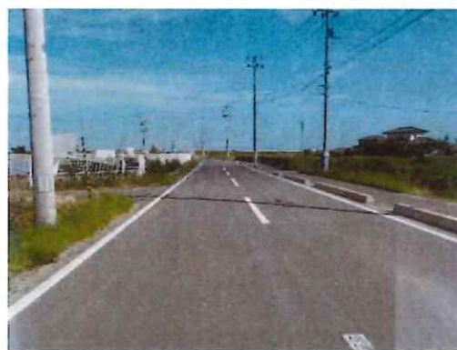
完成④（中間部～終点部を望む）