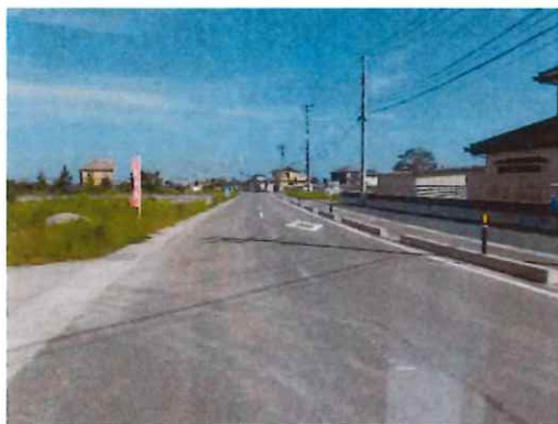
完成③（中間部～終点部を望む）