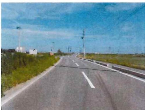
完成⑤（終点部周辺～終点部を望む）