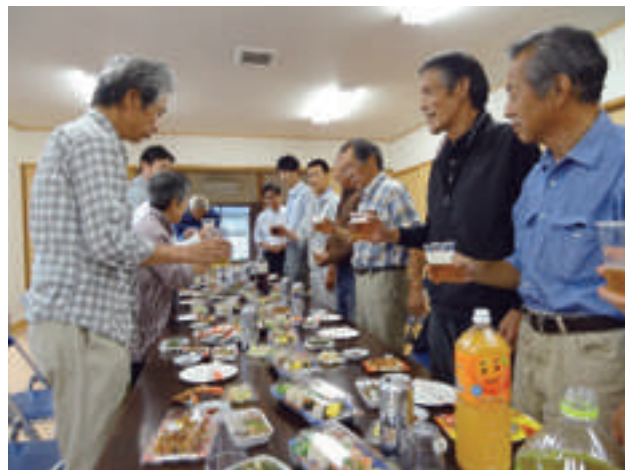
研修会終了後の交流・歓談