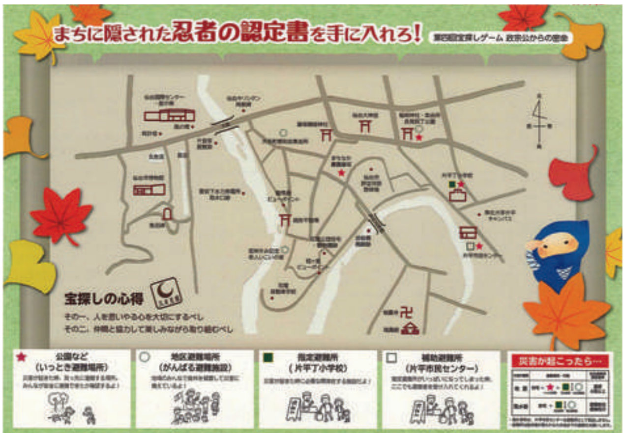
第4回防災宝探しゲームのガイドマップ