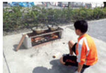
湯煎による炊飯の様子