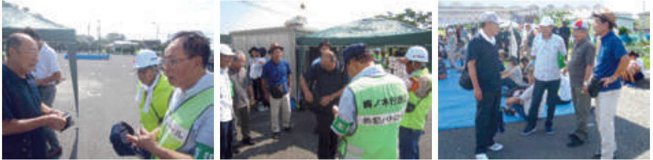
細谷区自主防災組織役員による見学と交流の様子