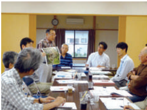
高清水地区九区と栗駒四日町の合同研修