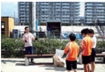
住民による火おこしの説明