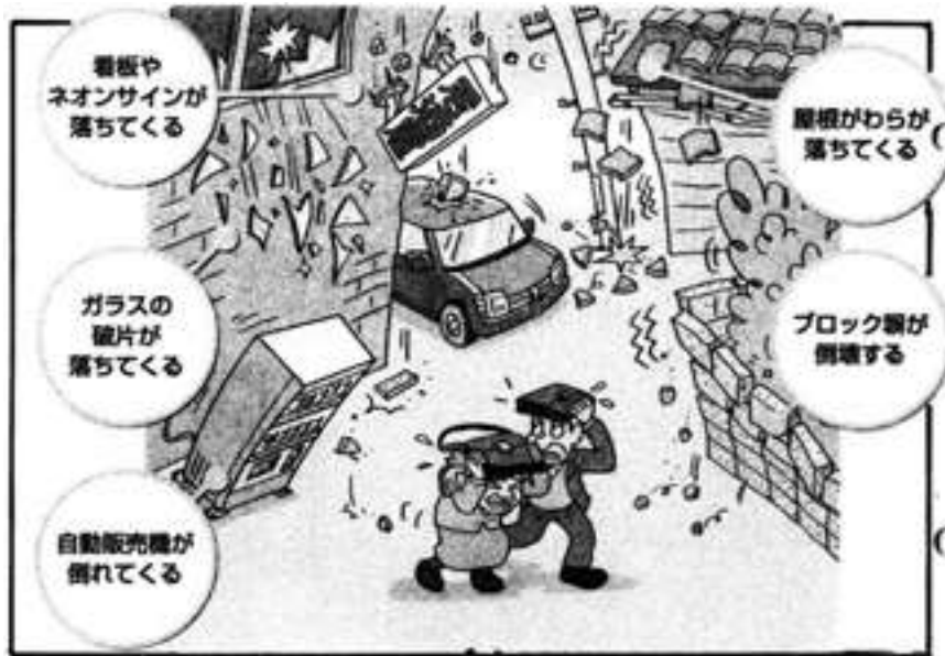
道路で地震が来た時の注意点