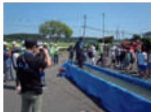
青生地区の運動会形式による防災訓練の様子