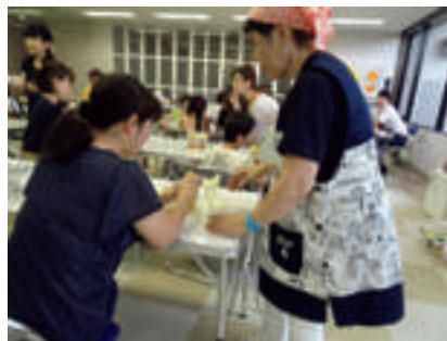
防災ワークショップの活動の様子