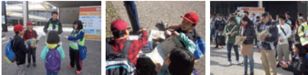
第4回防災宝探しゲームと見学・体験の様子