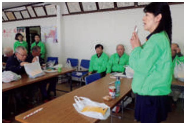
役立つ備蓄グッズの紹介