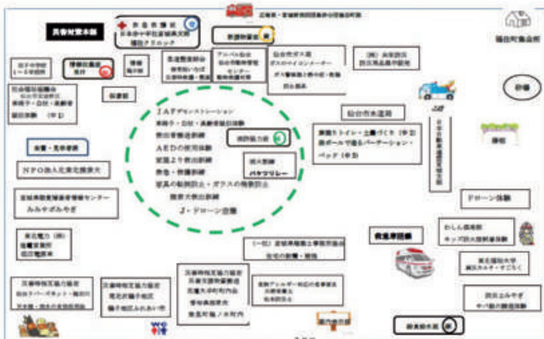
第17回福住町防火・防災訓練の会場配置図