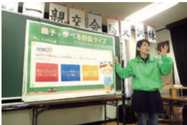
親子で学べる防災クイズ