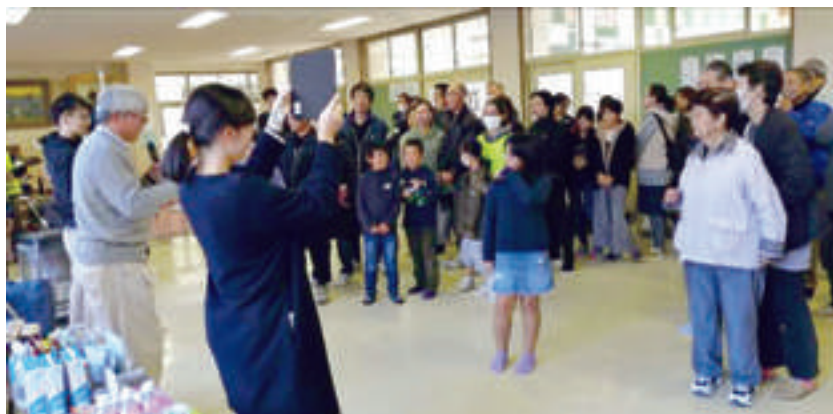
防災〇×クイズ取組の様子