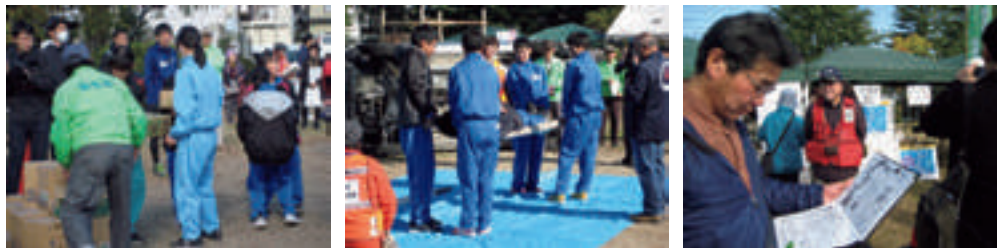
第17回福住町防火・防災訓練と見学の様子