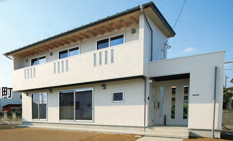
内陸部に完成した災害公営住宅（涌谷町）

白石市 角田市 登米市 栗原市 大崎市 蔵王町 七ヶ宿町 大河原町 村田町 柴田町 川崎町 丸森町 大和町 大郷町 富谷町 大衡村 色麻町 加美町 涌谷町 美里町