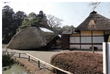
▲ 地震により倒壊した有備館

仙台藩の学問所跡「旧有備館及び庭園」は、日本最古の学問所建築として国の史跡および名勝に指定されています。茅葺きの書院造の建物は震災により主屋を残して完全に倒壊しましたが、元の部材を最大限に生かしながら、再建修理が進められています。