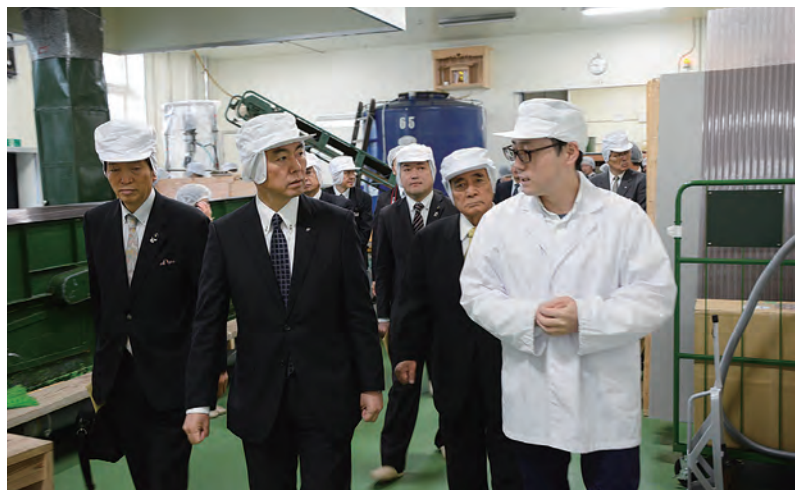
被災した酒造会社を視察する知事（栗原市）