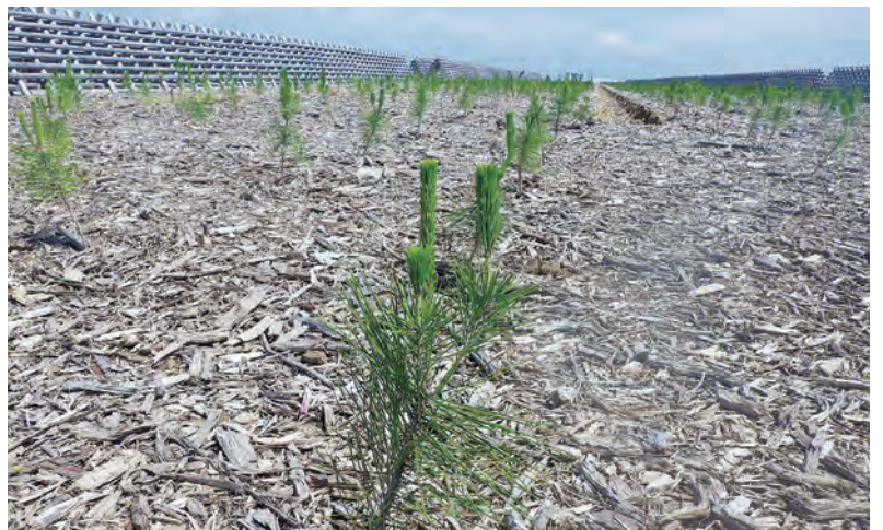
沿岸部の海岸林再生のため、蔵王町で栽培されたクロマツの苗木（蔵王町）