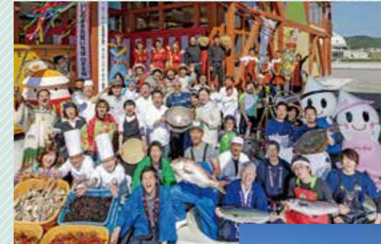
いしのまき元気いちば