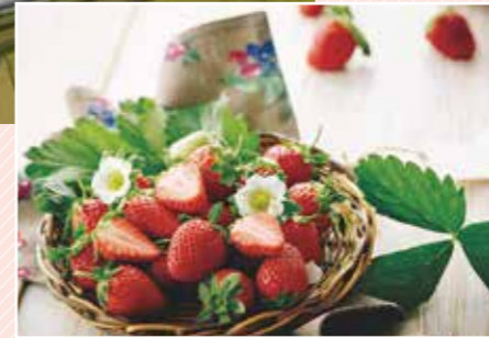
14. 新品種「にこにこベリー」