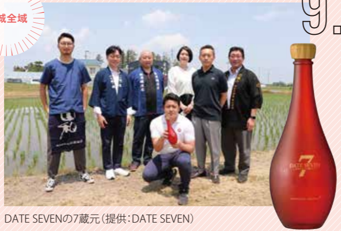
9. 宮城全域 DATE SEVENの7蔵元