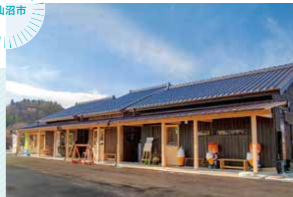
のどか 大島の観光施設「野杜海」