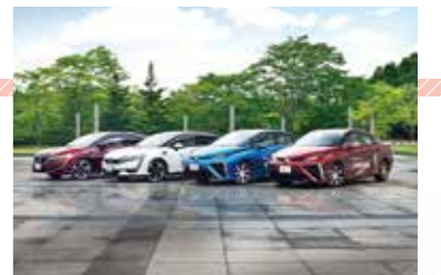
公用車として導入したFCV

宮城県では、震災の経験を踏まえ、水素エネルギーの利活用拡大に向けた取組を着実に進めていくことで、環境負荷の低減や災害対応能力の強化に加え、産業振興においても効果が期待できることから、平成27年6月に「みやぎ水素エネルギー利活用推進ビジョン」を策定しました。二酸化炭素排出量を削減し、地球温暖化の抑制や環境負荷の低減を推進するとともに、燃料電池自動車 (FCV) を災害時の非常用電源として活用できる体制の整備を進めることで、災害対応能力の強化を図っています。