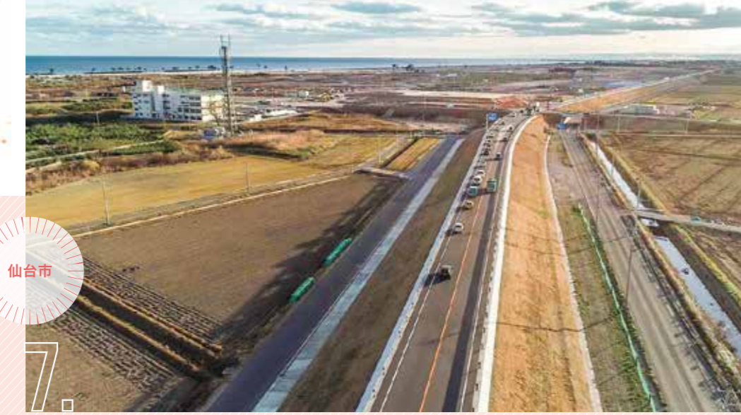
7. 仙台市 東部復興道路