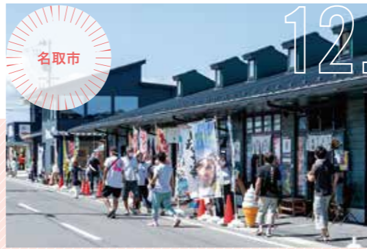
かわまちてらす開上