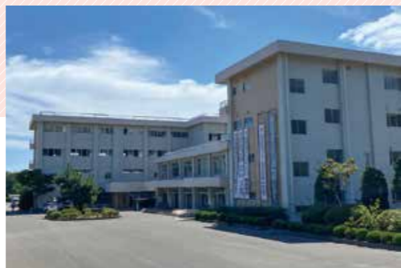
宮城県多賀城高等学校