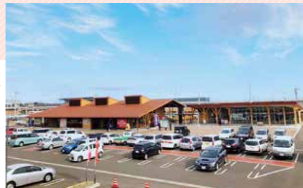
15. やまもと夢いちごの郷