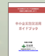
中小企業施策活用 ガイドブック