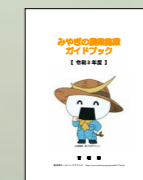
みやぎの農業施策 ガイドブック