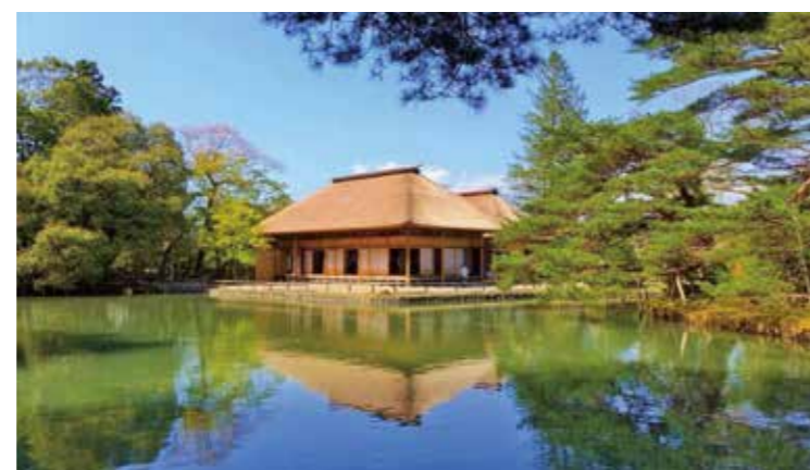
国指定史跡名勝「旧有備館および庭園」

自動車関連産業では、立地企業が東北地区での生産体制を強化したことにより、関連企業の工場進出が相次いだほか、高度電子機械関連産業についても関連企業の集積が進みました。あわせて、ものづくり産業の復興を担う人材の育成や、新たな産業で活躍できる人材を育成し、多様な雇用機会の創出に努めてきました。