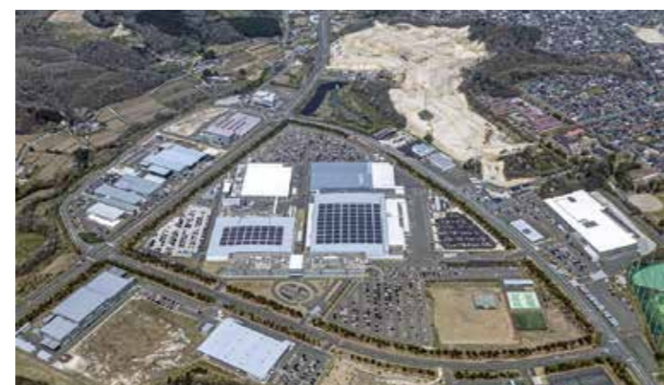
大和リサーチパーク