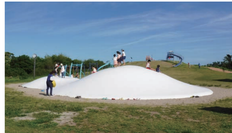
井土地区海岸公園冒険広場。平成30年7月に全面復旧しました。