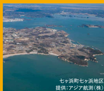
七ヶ浜町七ヶ浜地区