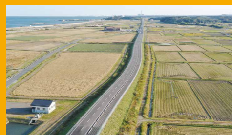
県道相馬亘理線 全線開通