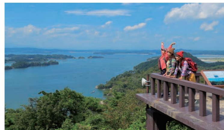
平成30年10月にオープンした宮城オルレの「奥松島コース」