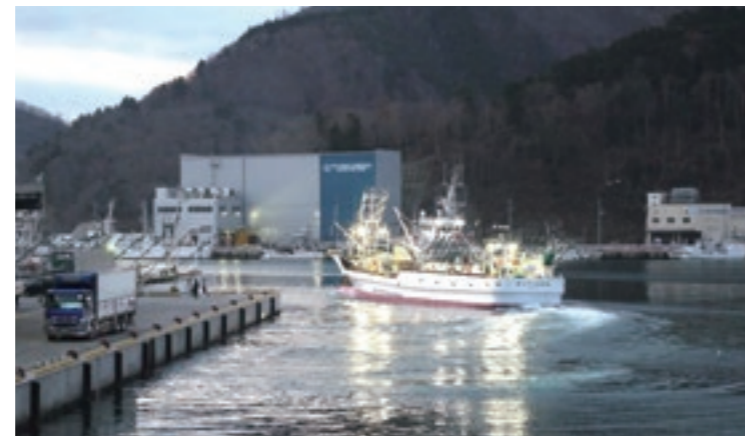
施設の再建が進む女川漁港(女川町)