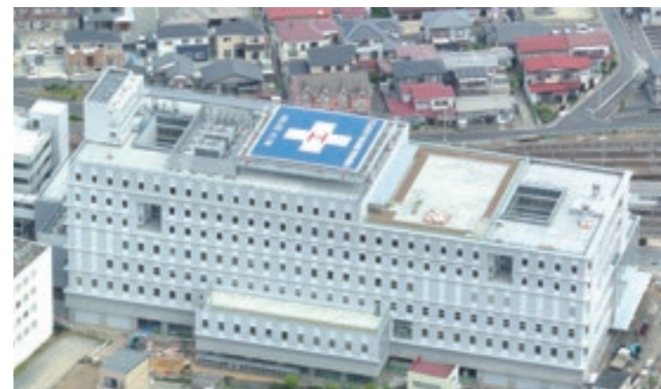
平成28年9月に開院した石巻市立病院(石巻市)

東松島市では、まちづくりの整備が進められました。平成28年9月には、防災集団移転団地「あおい地区」がまちびらき。地区内の宅地や災害公営住宅の引渡し完了したこと、新たなまちの門出を盛大に祝いました。また、11月には野蒜ヶ丘地区で最後の宅地が引き渡され、東松島市最大規模の防災集団移転促進事業の宅地整備が完了しました。さらに教育関連でも、平成29年1月に「宮野森小学校」の新校舎が完成。木のぬくもりに包まれた校舎で児童らが新学期を迎えました。