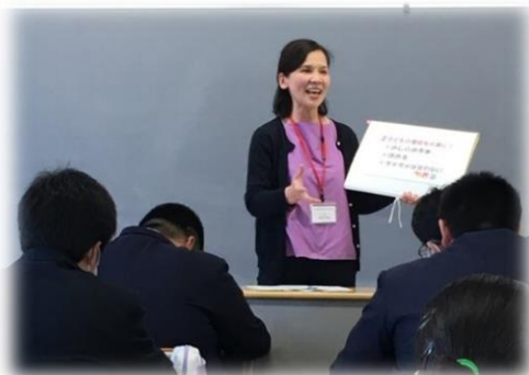
支援員による生活指導に関する講話の様子（高校）