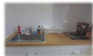
料理等を訓練できる ミニキッチン

令和元年度事業費：22,580,118 円（うち基金活用額：9,570,118 円）