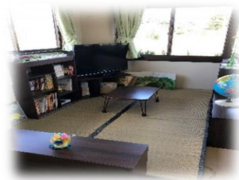
大郷町「とらいあんぐる」