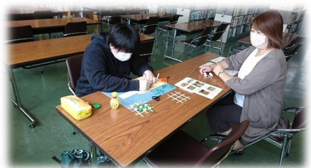
生徒との交流の様子（高校）

令和元年度事業費：369,723,611 円（うち基金活用額：139,031,756 円）