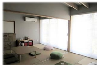
親子が過ごす居室