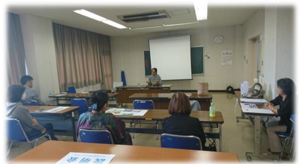
里親制度説明会の様子

令和元年度事業費：27,189,146円（うち基金活用額：13,003,146円）