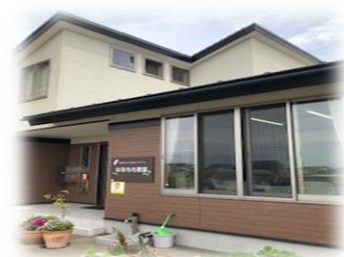
名取市「はなもも教室」