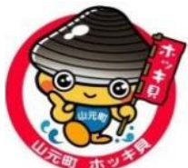
山元町観光PRキャラクター 「ホッキーくん」