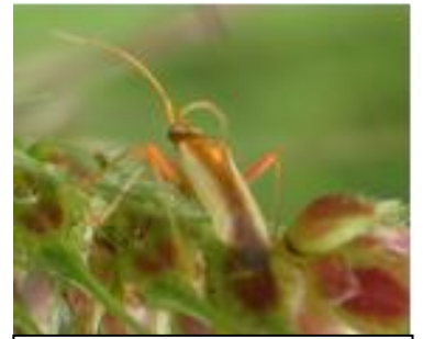
アカスジカスミカメ成虫