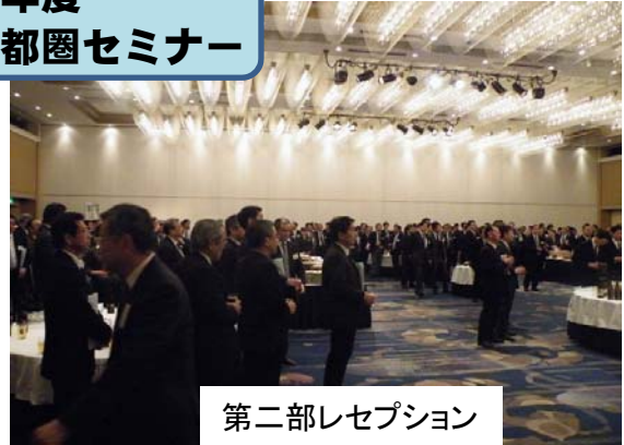
第二部レセプション