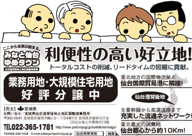
河北新報朝刊掲載 (平成24年11月30日)