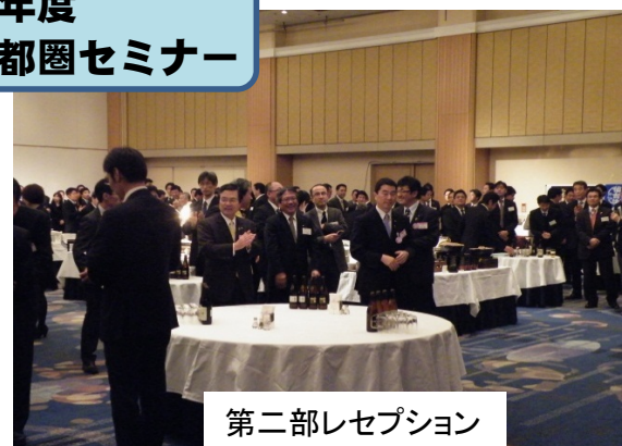
第二部レセプション