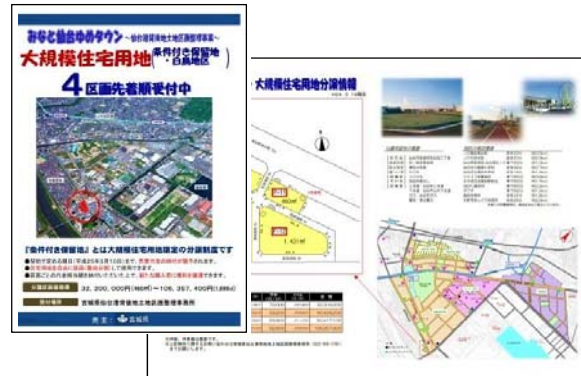
大規模住宅用地分譲パンフレット