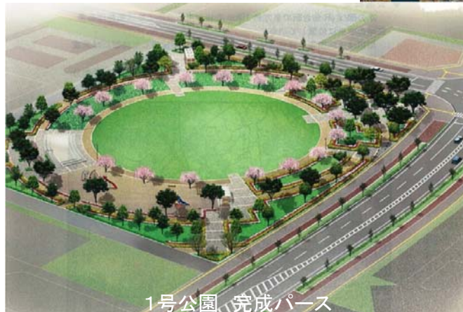
1号公園、完成パース