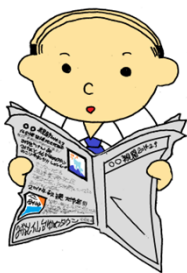
河北新報朝刊掲載 (平成26年3月10日)