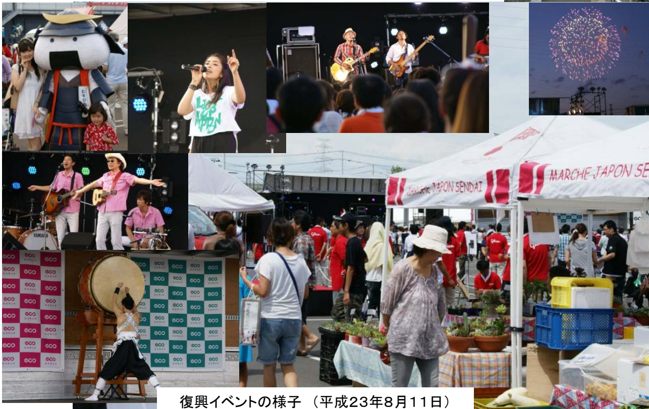
復興イベントの様子 (平成23年8月11日)