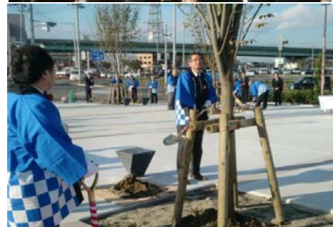
式典・植樹式の様子 (平成25年10月28日)