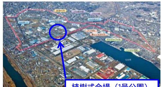
植樹式会場 (1号公園)