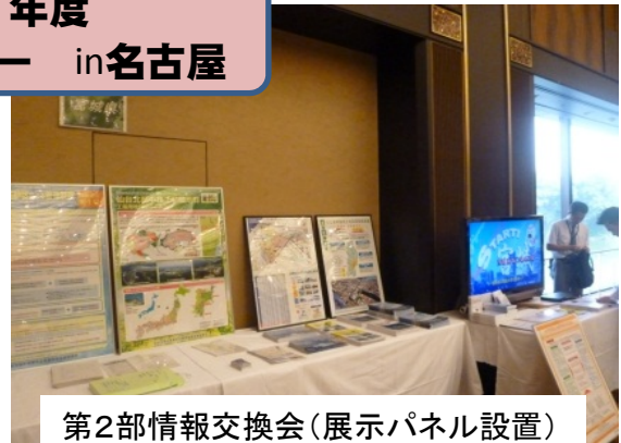
第2部情報交換会(展示パネル設置)