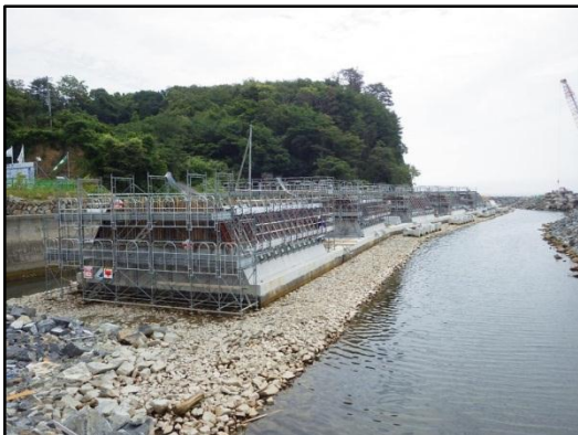
【白浜地区海岸の擁壁工事状況】