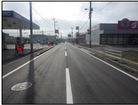
【(国)398号 石巻市鹿妻南地内】