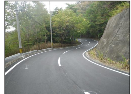
【(主)女川牡鹿線 女川町高白浜(3)地内】