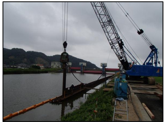
【真野川の鋼矢板打設工事状況】