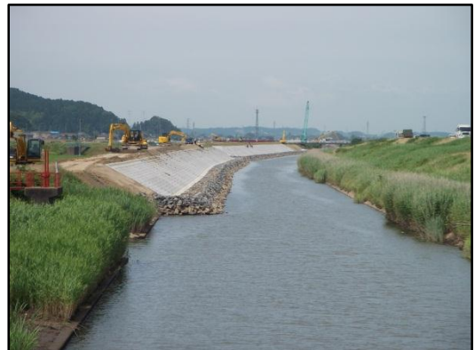
【追波川の築堤盛土工事状況】