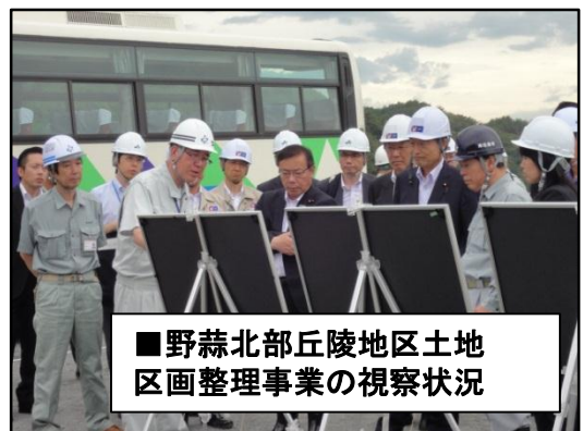
■野蒜北部丘陵地区土地区画整理事業の視察状況