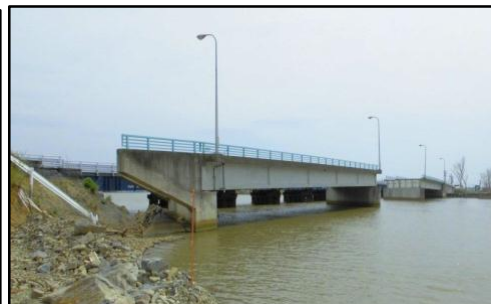
【定川大橋上流右岸側より撮影】

(2) 新北上大橋は、現在、仮設橋にて供用していますが、平成27年度末完成を目標に本復旧工事に着手するに当たり、工事の安全と北上地域の日も早い復興を祈念し、平成26年6月13日に安全祈願祭を開催しました。