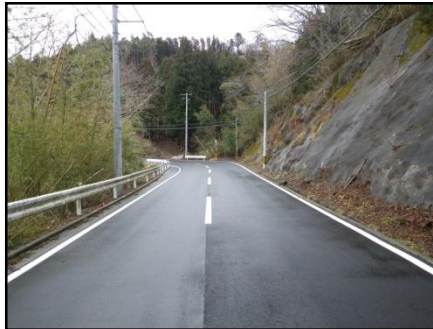
【(主)女川牡鹿線 女川町横浦(6)地内】