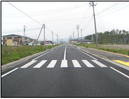
【(国)398号 石巻市渡波地内】