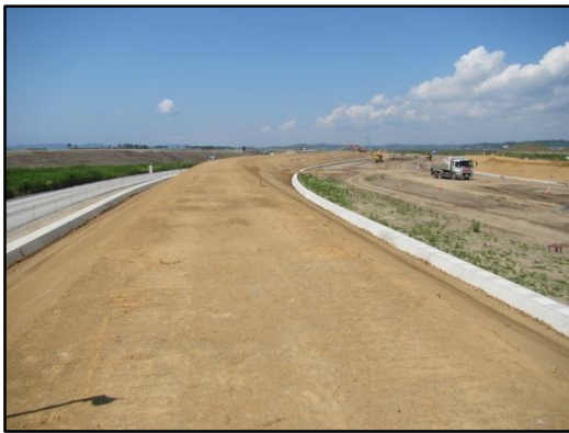
【北上運河の右岸築堤盛土完了状況】