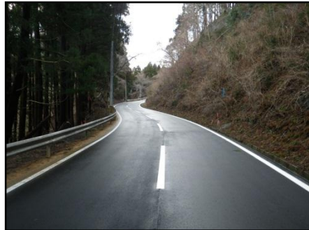
【(主)女川牡鹿線 女川町横浦(3)地内】