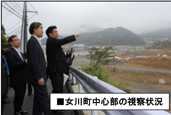
■女川町中心部の視察状況