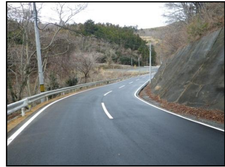
【(主)女川牡鹿線 女川町横浦(2)地内】