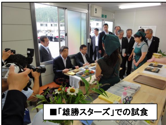
■「雄勝スターズ」での試食

東松島市では社会的孤立防止ソーシャルファーム事業、小松谷地地区災害公営住宅、大曲浜地区移転元土地利用促進事業、営農型太陽光発電による被災地農村を元気にする事業、野蒜北部丘陵地区土地区画整理事業を視察されました。