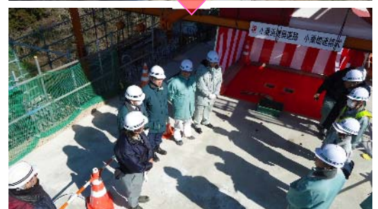
地上約50m上空での連結式▲ 東部土木復旧・復興だより第27号