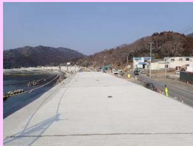
①大原地区海岸災害復旧工事 ②石巻市大原浜地先 ③天端被覆工事を施工中 ④97%