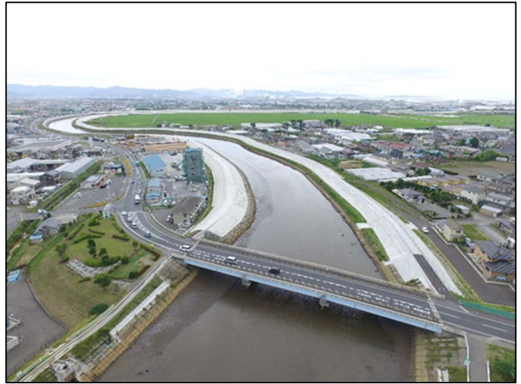
▲定川災害復旧工事（東松島市）

河川・海岸の災害復旧事業は、いままさに工事のピークを迎えており、平成31年度中に8事業15河川、6事業6海岸において、工事が完了する見込みとなっています。