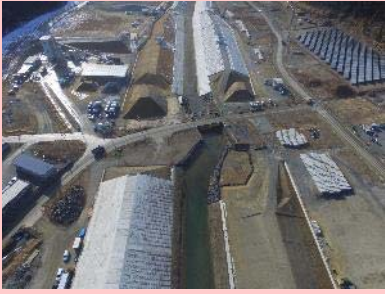
①大原川河川災害復旧工事 ②石巻市雄勝地内 ③護岸工事を施工中 ④67%