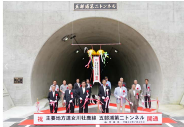
▲高白復興道路の第二五部浦トンネルは昨年7月に供用を開始