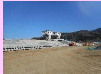
①谷川地区海岸災害復旧工事 ②石巻市谷川浜地内 ③築堤工事及び護岸工事を施工中 ④90%