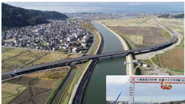
▲(国) 398号大瓜バイパスは昨年11月に供用を開始盛大に開通式を行いました▶