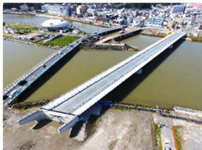
▲内海橋災害復旧旧工事(石巻市)