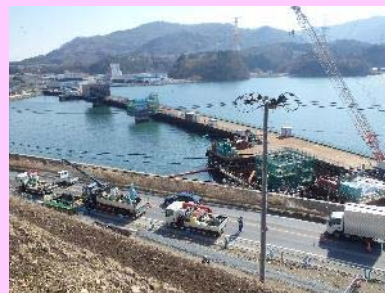
①浦宿道路改良工事 ②女川町浦宿浜地内 ③浦宿地区で橋梁上部工事を施工中 ④55%