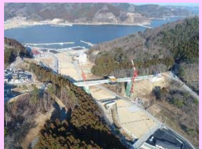
①小乗浜復興道路工事 ②女川町小乗浜地内 ③小乗浜地区で橋梁上部工事を施工中 ④73%