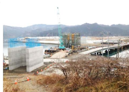
▲尾の崎橋災害復旧工事(石巻市)