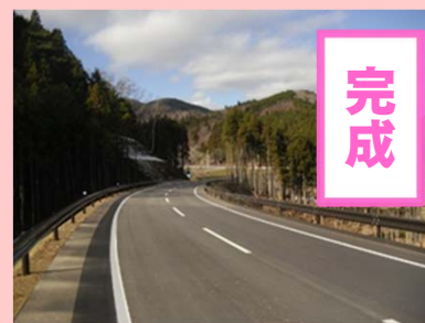
①国道398号御前浜復興道路工事 ②女川町御前浜地内 ③H29.12完成 ④100%