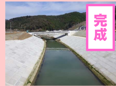
①女川災害復旧工事 ②女川町女川浜地内 ③H30.10完成 ④100%