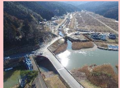
①加茂川河川改修工事 ②石巻市福地地内 ③仮設道路を施工中 ④55%