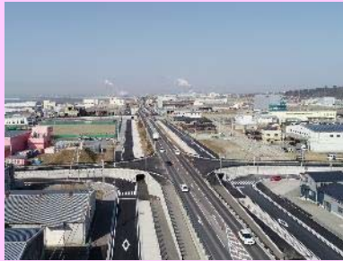
①門脇流留線道路改築工事 ②石巻市門脇～魚町地内 ③魚町工区において高盛土道路を部分供用 ④55%