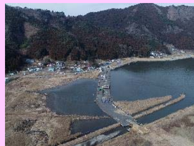
①富士川外1河川災害復旧工事 ②石巻市針岡地内外 ③地盤改良工事及び樋管工事を施工中 ④60%