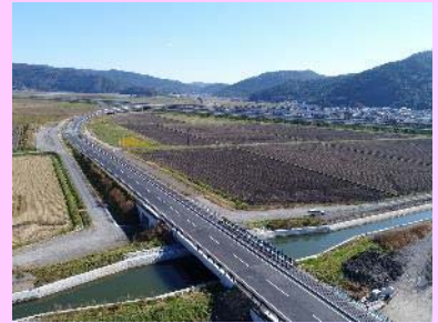
①国道398号石巻バイパスⅡ期工事 ②石巻市大瓜地内 ③真野川橋・大和田川橋が完成 全線供用を開始 ④99%