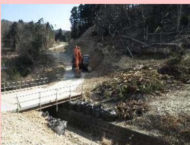
①飯子浜復興道路工事 ②女川町飯子浜地内 ③橋梁下部工事施工のための工事用道路工を施工中 ④44%