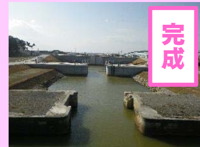
①北北上運河災害復旧工事 ②石巻市蛇田地内外 ③H31.1完成 ④100%