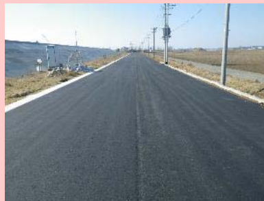
①大曲道路災害復旧工事 ②東松島市大曲地内 ③大曲地区で舗装工を施工中 ④65%