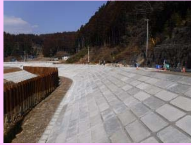
①相川沢川災害復旧工事 ②石巻市北上町十三浜字相川地内 ③法覆護岸工を施工中 ④86%