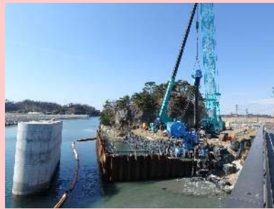
①宮戸道路改良工事 ②東松島市宮戸地内 ③松ヶ島橋の橋台工を撤去中 ④60%