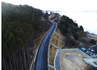
▲小網鞍復興道路はまもなく完成