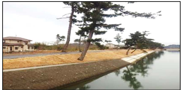
▲東名運河災害復旧工事（東松島市）