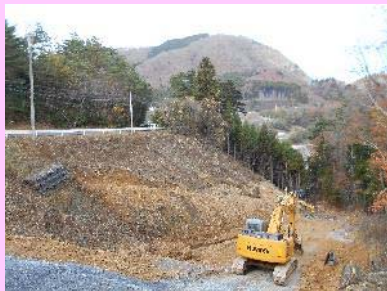
①高白復興道路工事 ②女川町高白浜地内 ③高白地区で補強土壁工事を施工中 ④47%