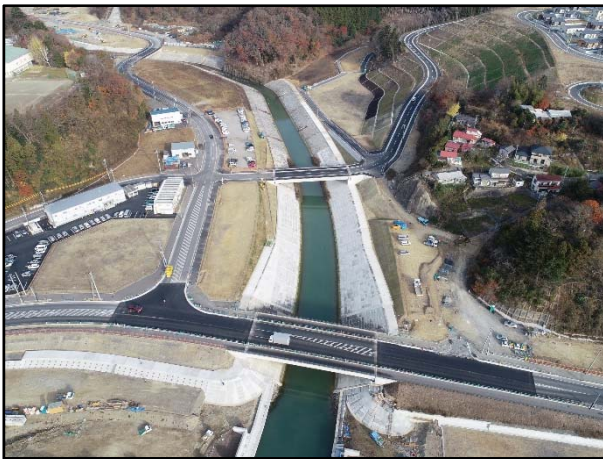
▲女川災害復旧工事（女川町）