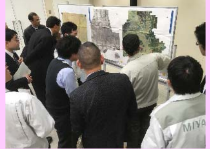
研修会後も熱論は続く