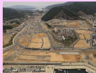
①国道398号女川市街地道路改良工事 ②女川町女川浜地内 ③女川浜地区で舗装工事を施工中 ④96%