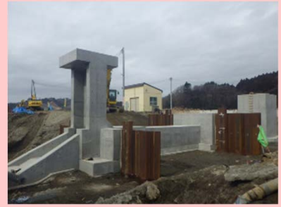
①追波沢川外災害復旧工事 ②石巻市北上町十三浜字江川地内外 ③樋管工事を施工中 ④97%