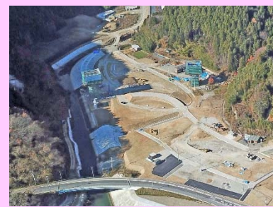
①国道398号相川復興道路事業 ②石巻市北上町十三浜 ③道路改良工事及び橋梁工事を施工中 ④72%