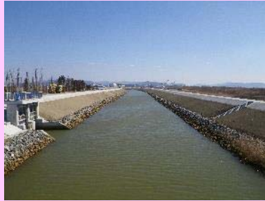
①北北上運河災害復旧工事 ②東松島市大曲地内外 ③法覆護岸工事を施工中 ④94%