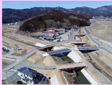
①中島川外河川災害復旧工事 ②石巻市中島字石湊地内外 ③法覆護岸工を施工中 ④88%