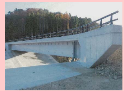
①国道398号雄勝復興道路工事 ②石巻市水浜～味噌作地内 ③味噌作地区で道路改良工事を施工中 ④19%