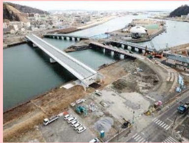
①国道398号内海橋災害復旧工事 ②石巻市中央地内 ③内海橋が完成 取り付け道路を施工中 ④69%