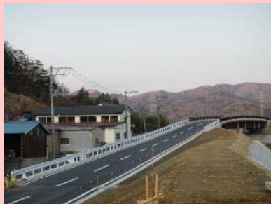
①真野川外4河川災害復旧工事 ②石巻市大瓜地内外 ③護岸工事と取付道路工を施工中 ④97%