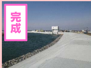
①定川災害復旧工事 ②東松島市大曲地内外 ③H30.7完成 ④100%