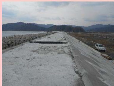
①横須賀地区海岸災害復旧工事 ②石巻市長面地内 ③天端工事を施工中 ④97%