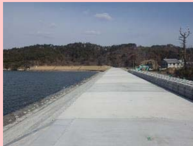
①長石地先海岸災害復旧工事 ②東松島市大塚地内 ③圧密沈下促進中 ④86%