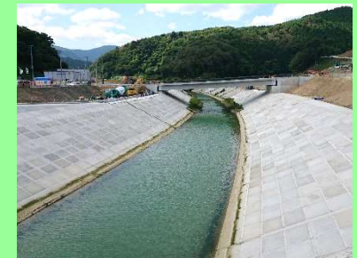
①女川災害復旧工事 ②女川町女川浜地内 ③護岸工を施工中 ④96%