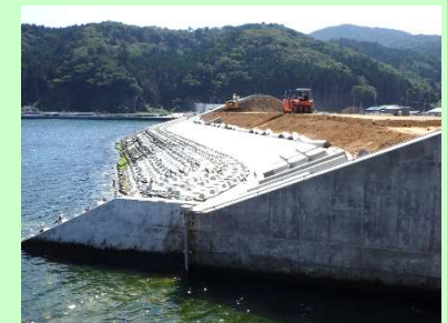
①谷川地区海岸災害復旧工事 ②石巻市谷川浜地内 ③築堤工事及び護岸工を施工中 ④79%