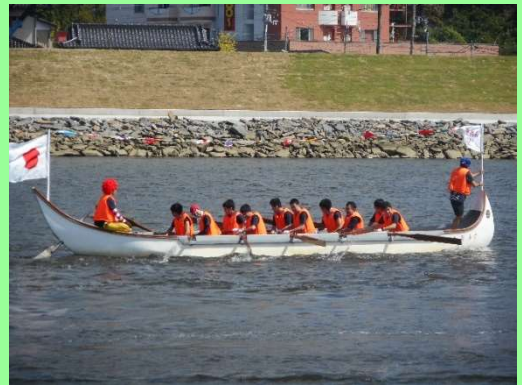
予選17組 3チーム中二位でゴール！