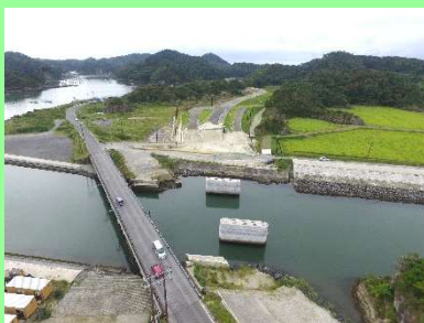
①宮戸道路改良工事 ②東松島市宮戸地内 ③宮戸地区の旧松ヶ島橋において旧橋大を撤去中 ④55%