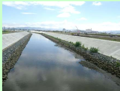
①北北上運河災害復旧工事 ②東松島市大曲地内外 ③大曲土手下地区で護岸工・橋梁上部工を施工中 ④91%