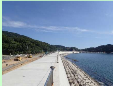
①大原地区海岸災害復旧工事 ②石巻市大原浜地先 ③大原地区で天端被覆工を施工中 ④95%