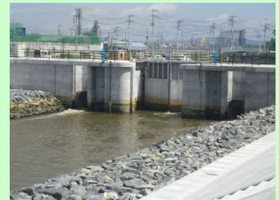
①北北上運河災害復旧工事 ②石巻市蛇田地内外 ③金閘門操作室を施工中 ④99%