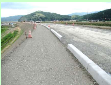
①中島川外河川災害復旧工事 ②石巻市中島字石湊地内外 ③中島川で築堤・兼用道路工事を施工中 ④88%