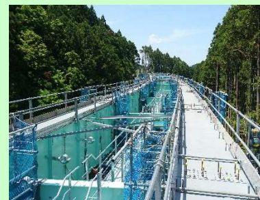
①国道398号相川復興道路事業 ②石巻市北上町十三浜 ③道路改良及び橋梁を施工中 ④60%