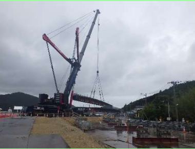
①真野川外4河川災害復旧工事 ②石巻市大瓜地内外 ③大瓜地内外で石崎橋橋梁上部工と護岸工を施工中 ④87%