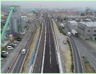
①門脇流留線道路改築工事 ②石巻市門脇～魚町地内 ③魚町工区において高盛土道路を部分供用 ④47%