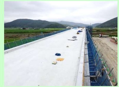
①国道398号石巻バイパスⅡ期工事 ②石巻市大瓜地内 ③真野川橋・大和田川橋の床版工が完了 ④94%