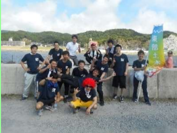
漕ぎ終えてパチリ 疲労困憊・・・

今年も石巻川開き祭りで行われる『孫兵衛船競漕』に土木事務所として参加しました。結果は予選敗退となりましたが、地元のお祭りに参加することで、地元愛がより一層深いものとなりました。