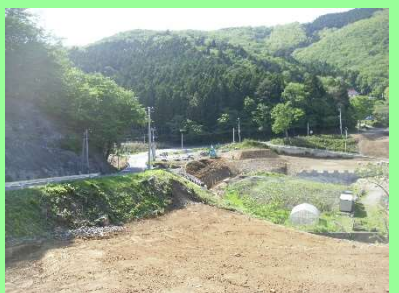
①高白復興道路工事 ②女川町高白浜地内 ③高白地区で路体盛土工・補強土壁工を施工中 ④47%