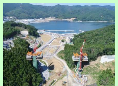
①小乗浜復興道路工事 ②女川町小乗浜地内 ③小乗浜地区で橋梁上部工を施工中 ④67%