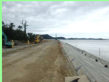
①長石地先海岸災害復旧工事 ②東松島市大塚地内 ③大塚地内で護岸工を施工中 ④69%