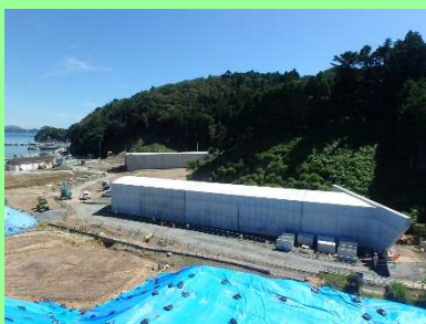
①飯子浜復興道路工事 ②女川町飯子浜地内 ③飯子浜地区で函渠工を施工中 ④40%