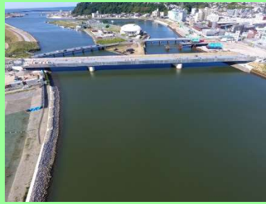
①国道398号内海橋災害復旧工事 ②石巻市中央地内 ③内海橋の橋梁付属物を施工中 ④63%