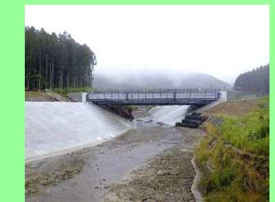
①国道398号雄勝復興道路工事 ②石巻市水浜～味噌作地内 ③味噌作地区で道路改良及び橋梁を施工中 ④16%