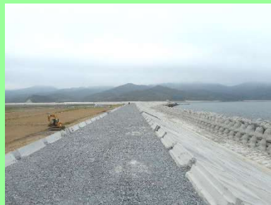
①横須賀地区海岸災害復旧工事 ②石巻市長面地内 ③護岸工を施工中 ④97%