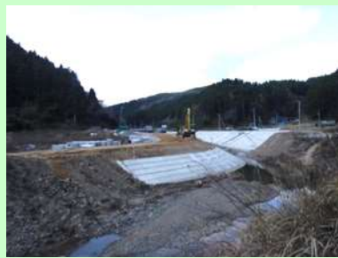
①相川沢川災害復旧工事 ②石巻市北上町十三浜字相川地内 ③築堤工事を施工中 ④62%