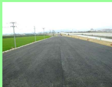
①大曲道路災害復旧工事 ②東松島市大曲地内 ③大曲地区で盛土工がほぼ完了し舗装工を施工中 ④45%