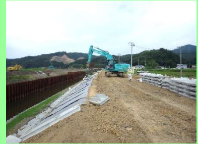
①追波沢川外災害復旧工事 ②石巻市北上町十三浜字江川地内外 ③追波沢川で護岸工事を施工中 ④66%