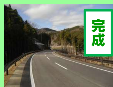
①国道398号御前浜復興道路工事 ②女川町御前浜地内 ③H29.12完成 ④100%