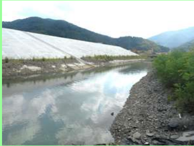
①大原川河川災害復旧工事 ②石巻市雄勝地内 ③護岸工事を施工中 ④64%