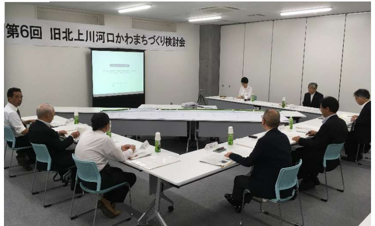
検討会の様子。旧北上川河口部のまちづくりについて活発な議論がなされました。

当所においても、引き続き国、石巻市と連携して、よりよいまちづくりが進むよう協力してまいります。