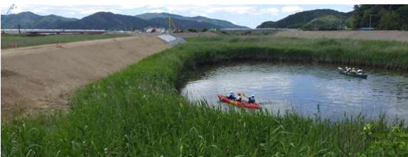
上) カヌー教室 下) 工事概要説明

また、説明会後はNPO法人ひたかみの里様のご指導によるカヌー体験教室も行われ、工事現場に元気な子ども達の声が響きました。