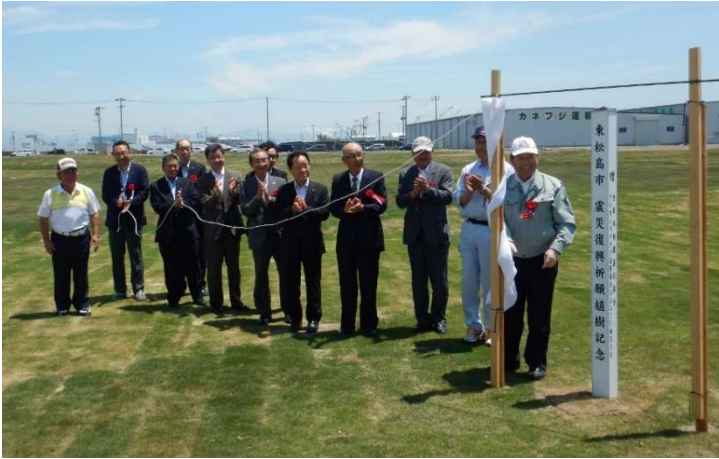
植樹記念碑除幕の様子

7月1日（日曜日）、現在整備中である矢本海浜緑地内のパークゴルフ場において、関係者約50人が参加し桜の植樹を祝うセレモニー行われました。