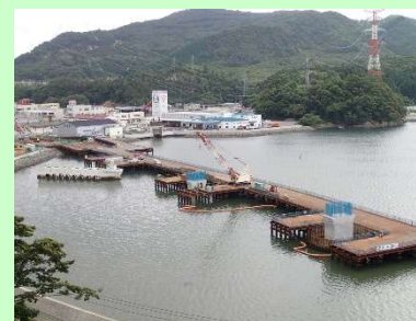
①浦宿道路改良工事 ②女川町浦宿浜地内 ③浦宿地区で橋梁下部工完了, 上部工を施工中 ④54%