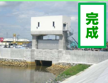
①定川災害復旧工事 ②東松島市大曲地内外 ③H30.7完成 ④100%