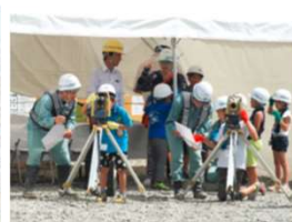
上) 集合写真 下左) 高所作業車試乗 下右) 測量機器体験