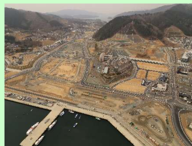
①国道398号女川市街地道路改良工事 ②女川町女川浜地内 ③女川浜地区で舗装工を施工中 ④90%