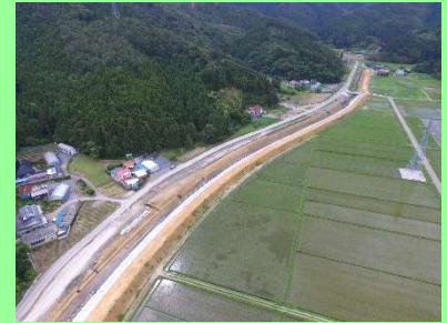
①加茂川河川改修工事 ②石巻市福地地内 ③福地地内で仮設道路を施工中 ④34%