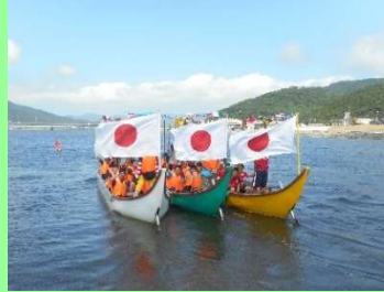
スタート前 白い船が土木チーム