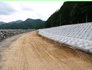
①富士川外1河川災害復旧工事 ②石巻市針岡地内外 ③針岡地区で築堤工事及び護岸工を施工中 ④58%