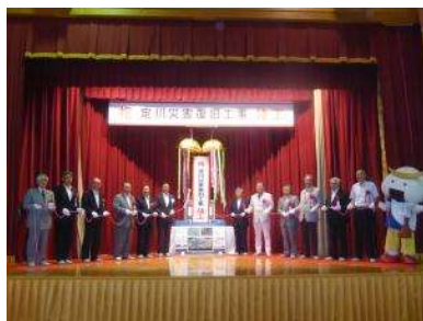
上) 完成写真 左下) 3.11東日本伝承板・竣工記念銘板除幕 右下) くす玉開披