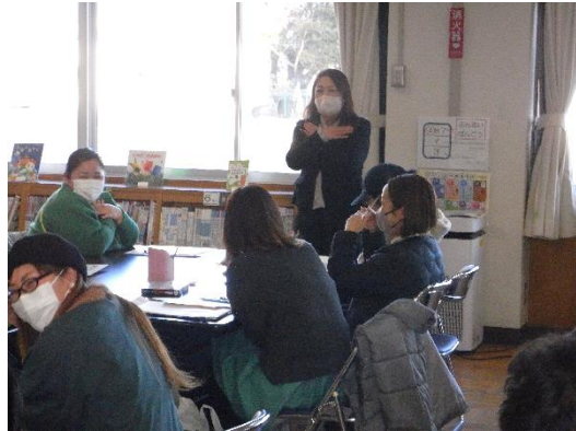
② アイスブレイク(班ごと自己紹介)