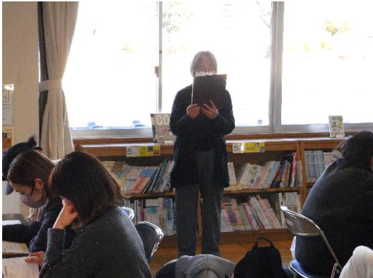
③ みんなのルール発表