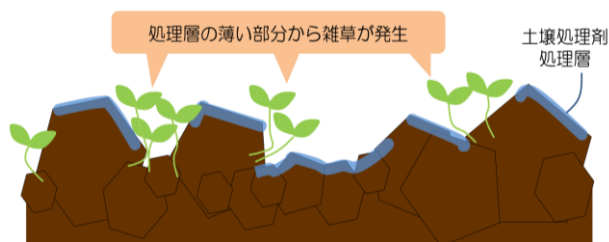
図3 碎土不良による雑草発生