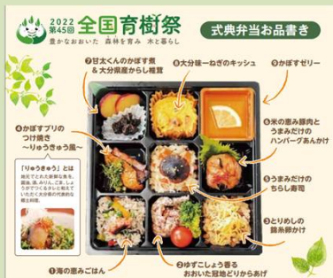
おもてなし弁当 (R4大分県)