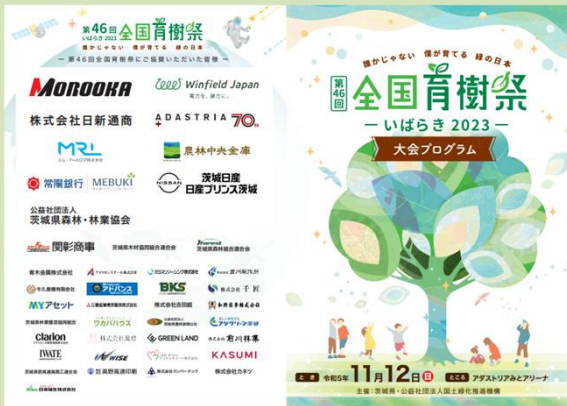
式典プログラムへの掲載 (R5茨城県)