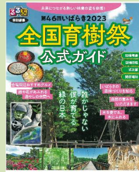
大会PRグッズの作成 (R5茨城県)