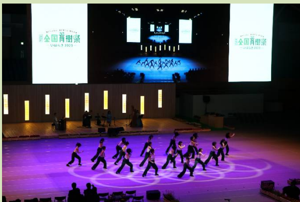
式典行事への参加者優先確保 (R5茨城県)