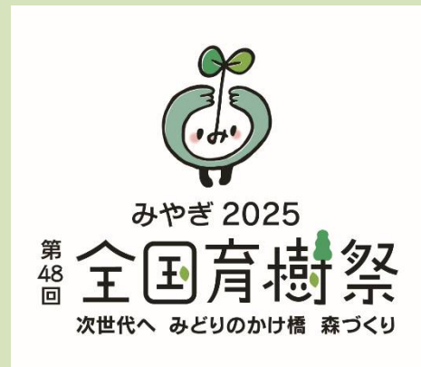
ロゴマーク等の利用