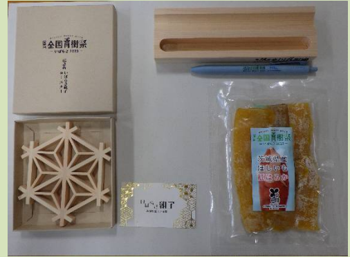
参加者記念品 (R5茨城県)