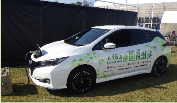
車両の無償貸与 (R5茨城県)