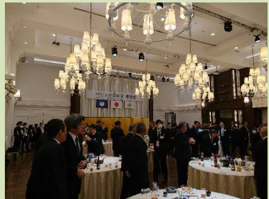
レセプションへの参加者優先確保 (R5茨城県)