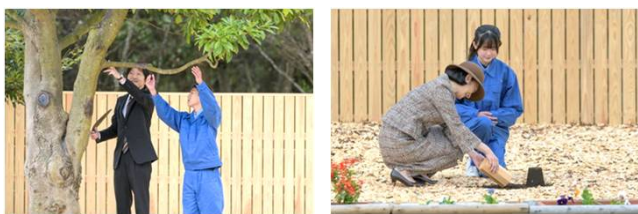
お手入れ行事(令和5年 茨城県)

全国植樹祭において天皇皇后両陛下がお手植えされた樹木への、皇族殿下によるお手入れ