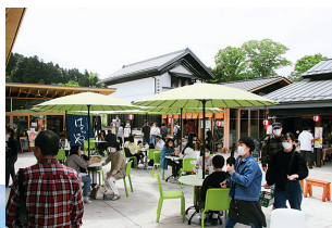
にぎわいを見せる「とみやど」

富谷市を代表する特産品がブルーベリーとはちみつです。富谷産はちみつは、今年度、日本はちみつマイスター協会から日本一となる「最優秀賞」と「優秀賞」を受賞しました。春と秋には、これらの特産品を使用した「とみやスイーツフェア」を開催するなど、「スイーツのまち」づくりを推進しています。