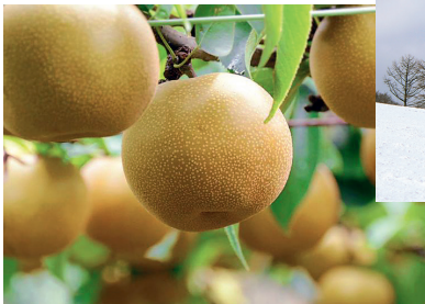
県内一の生産量を誇る梨

蔵王町では、春夏秋冬いろいろな特産物を味わうことができます。県内一の生産量を誇る「梨」をはじめ、桃やリンゴなどのフルーツ。