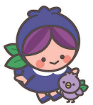
富谷市公式キャラクター フルベリッ娘とフルビヨ