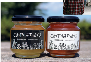
日本一を受賞した富谷産はちみつ

富谷市は、宮城県のほぼ中央に位置し、仙台都市圏の居住機能を担うエリアとして、大規模な住宅地が次々に開発・分譲されています。本市は、「住みたくなるまち日本一」を目指してまちづくりを進めており、民間調査機関が発表する各種自治体ランキングでは県内1位、東北1位を連続して獲得するなど、高い評価を得ています。富谷産はちみつは、今年度、日本はちみつマイスター協会から日本一となる「最優秀賞」と「優秀賞」を受賞しました。春と秋には、これらの特産品を使用した「とみやスイーツフェア」を開催するなど、「スイーツのまち」づくりを推進しています。