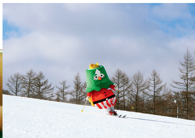
ざおうさまもスキーを満喫

豊富な水と豊かな土壌から作られるお米。昼夜の寒暖差が甘さとうまみを引き出す高原野菜。特に、ずっしりまっすぐな高原大根は甘くてみずみずしいです。また、畜産も盛んで、チーズなどの乳製品や肉類、卵も自慢です。