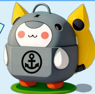
DEFENSEイメージキャラ 「まもちゃん」