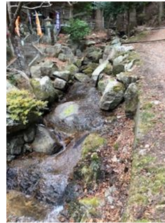
流れ石積み技法を用いた、小河川の改修事業