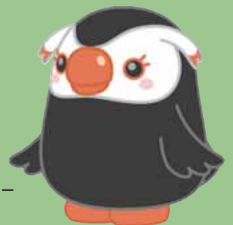
北方領土イメージキャラクター エリカちゃん