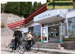
南川ダム資料館で「サブチャリ」を貸し出し