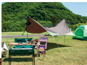
自然を満喫できる 星空サブローPARK