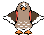
大崎市公式キャラクター バタ崎さん