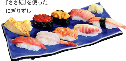
『ささ結』を使ったにぎりずし