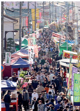
多くの人でにぎわう鹿島台互市