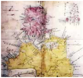
江戸幕府撰 正保日本図 (1644年)

1604年(慶長9年)、江戸幕府は松前藩に蝦夷地での交易権を認めました。松前藩は、北方領土や千島列島に住むアイヌの人々とも交流を始めました。