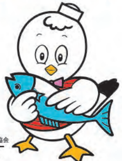
〈一社〉女川観光協会 公式キャラクター シーバルちゃん