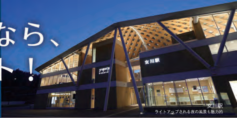
女川駅 ライトアップされる夜の風景も魅力的