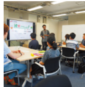
カードを使って、海外の方へ向けての実践も行われています。

check! 02 「まず身を守る」という メッセージを 子どもや外国人にも、 伝えるために。